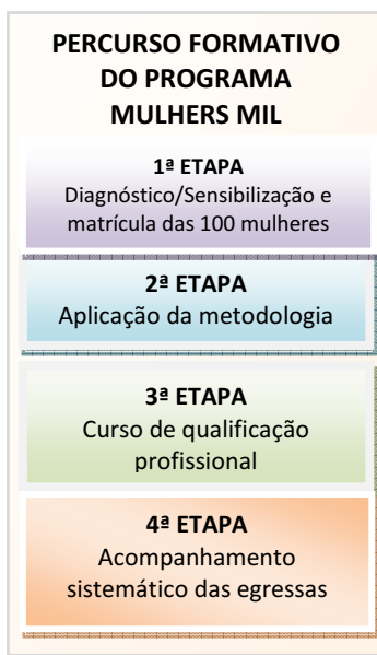
Figura 2 — Etapas do percurso formativo do Programa Mulheres Mil