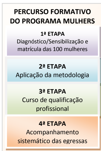
Figura 1 - Etapas do percurso formativo do Programa Mulheres Mil