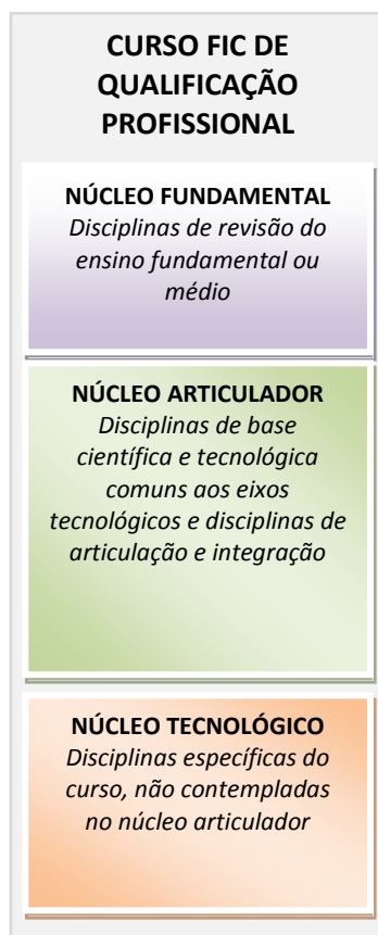
Figura 1 – Representação gráfica do desenho e da organização curricular dos cursos FIC de qualificação profissional

Convém esclarecer que o tempo mínimo de duração previsto, legalmente, para os cursos FIC é o estabelecido no Catálogo Nacional de Cursos FIC ou equivalente.