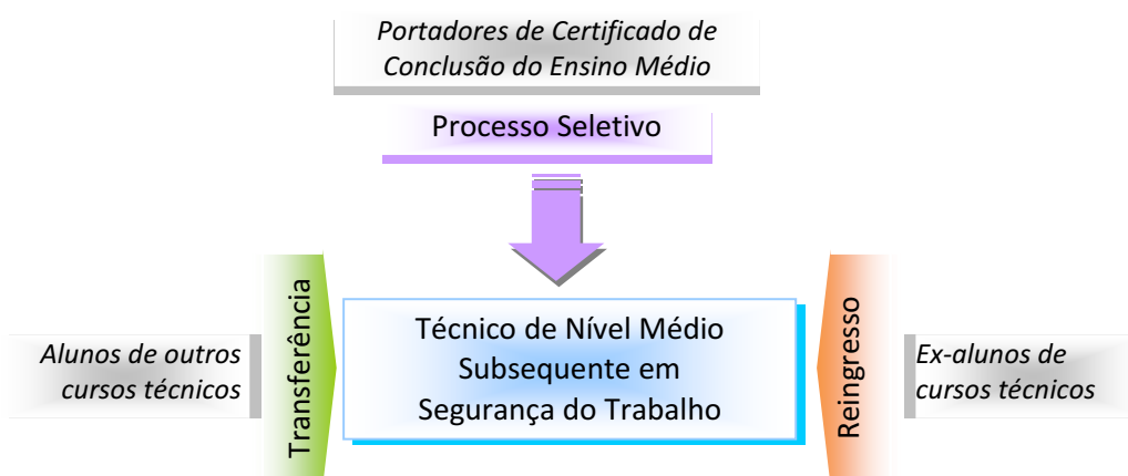
Figura 1 – Requisitos e formas de acesso ao curso.