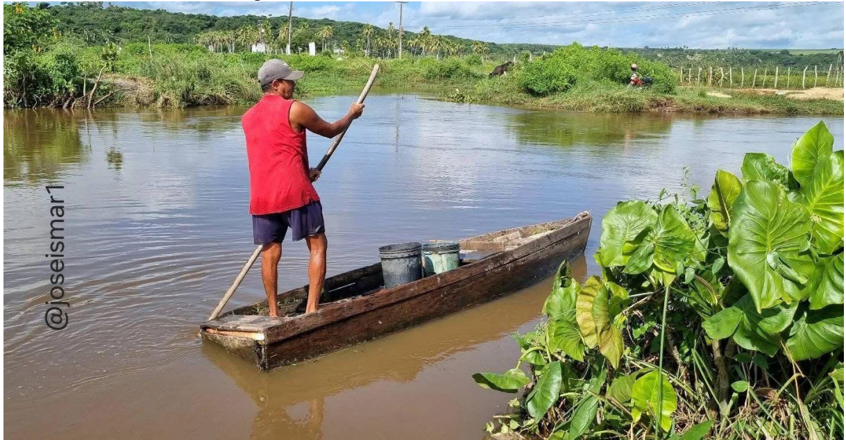
Figura 6 – Pesca no Rio Trairí em Currais.