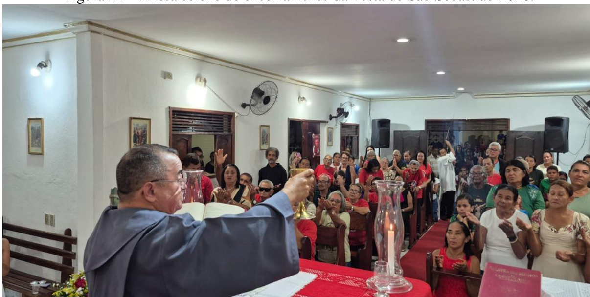
Figura 24 – Missa solene de encerramento da Festa de São Sebastião 2026.