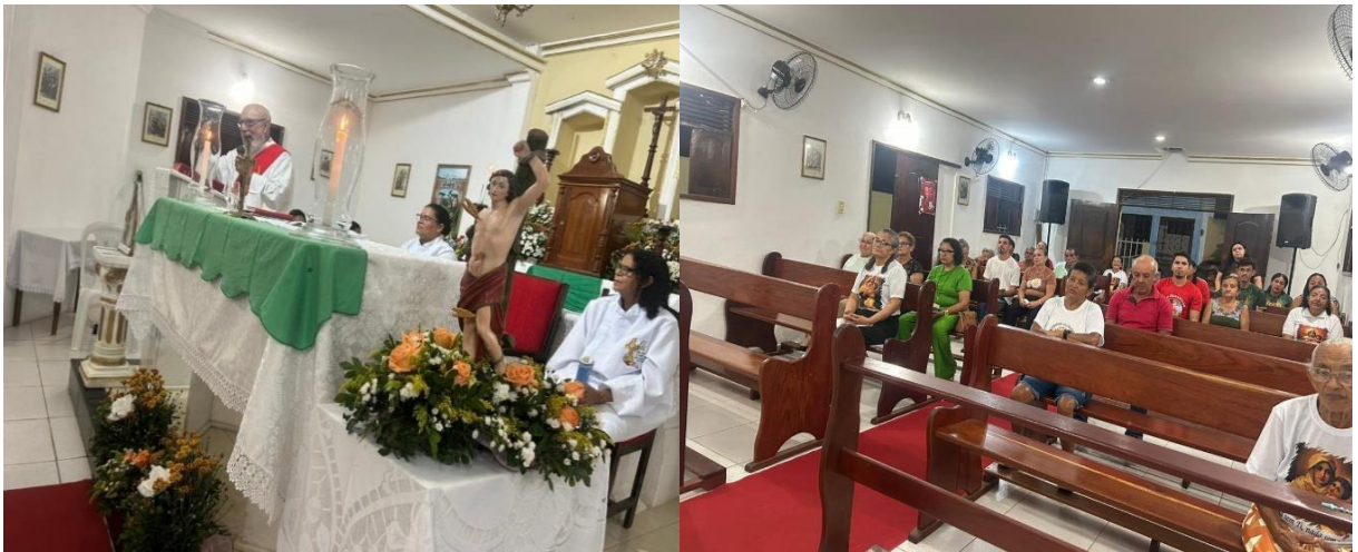
Figura 22 – Segunda noite do Tríduo.