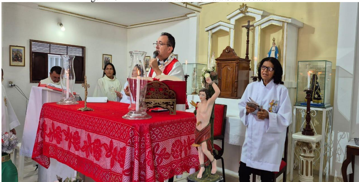
Figura 19 – Missa votiva em honra a São Sebastião.