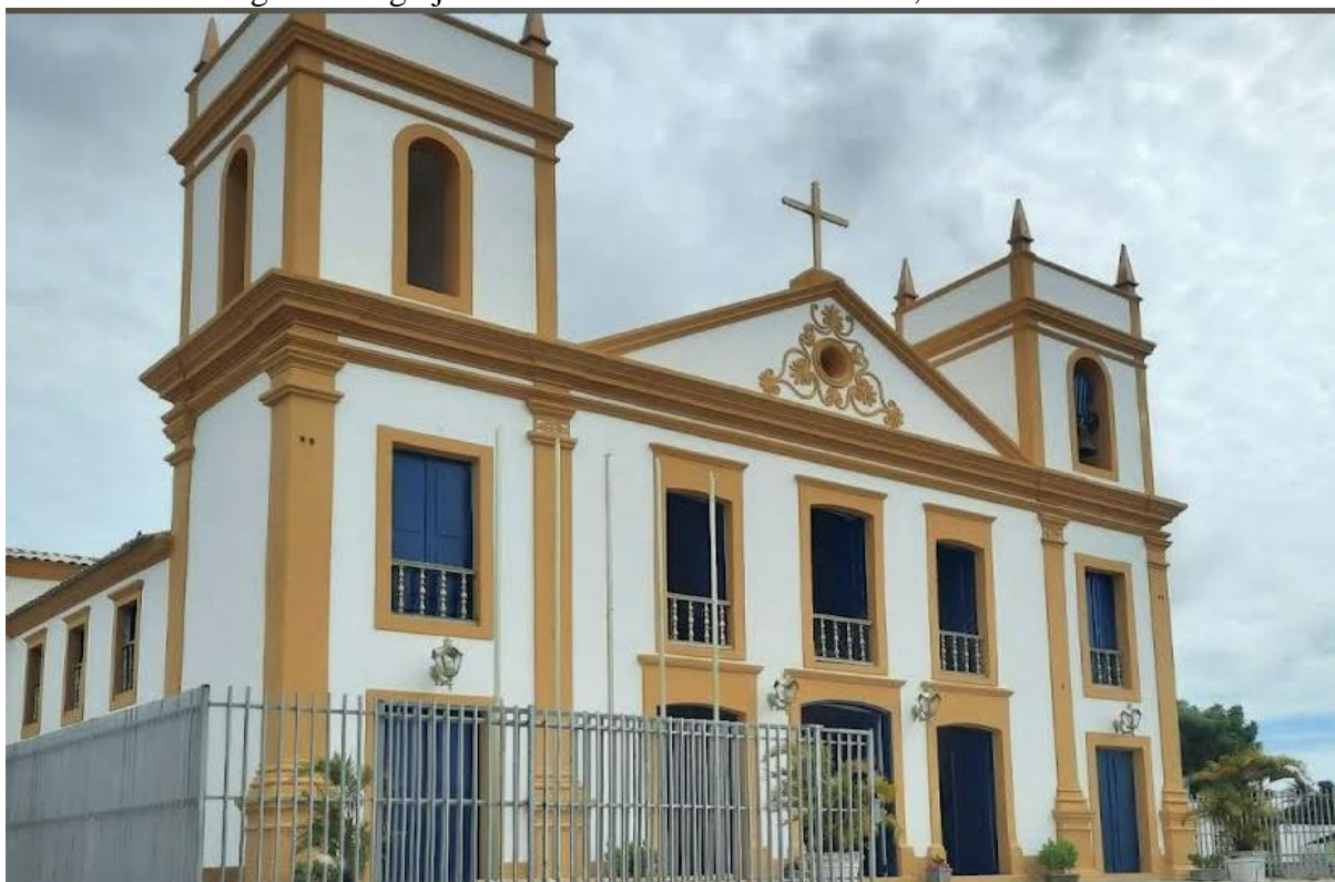
Figura 2 – Igreja Matriz de Nossa Senhora Do Ó, Nísia Floresta.