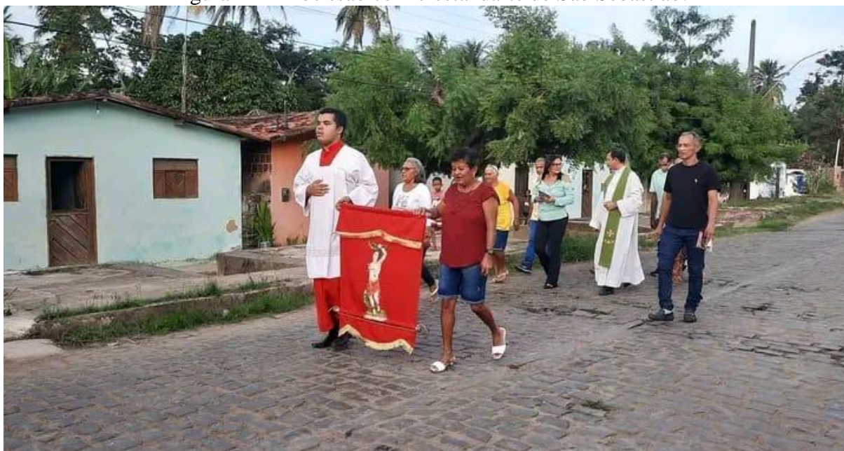
Figura 11 – Procissão com o estandarte de São Sebastião.