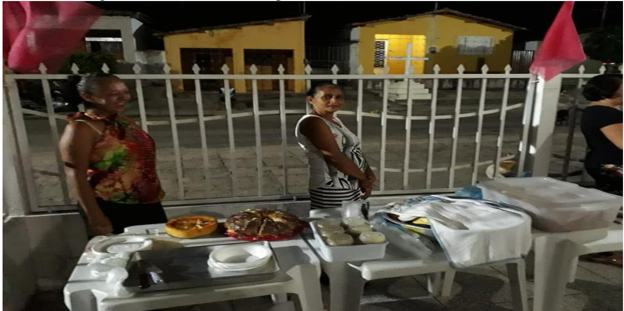
Figura 14 – Quermesse da capela na Festa de São Sebastião em 2018.