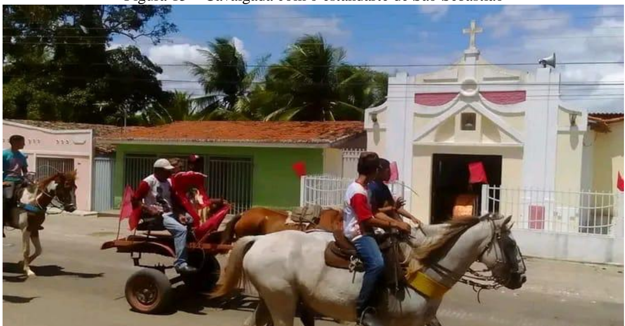
Figura 15 – Cavalgada com o estandarte de São Sebastião