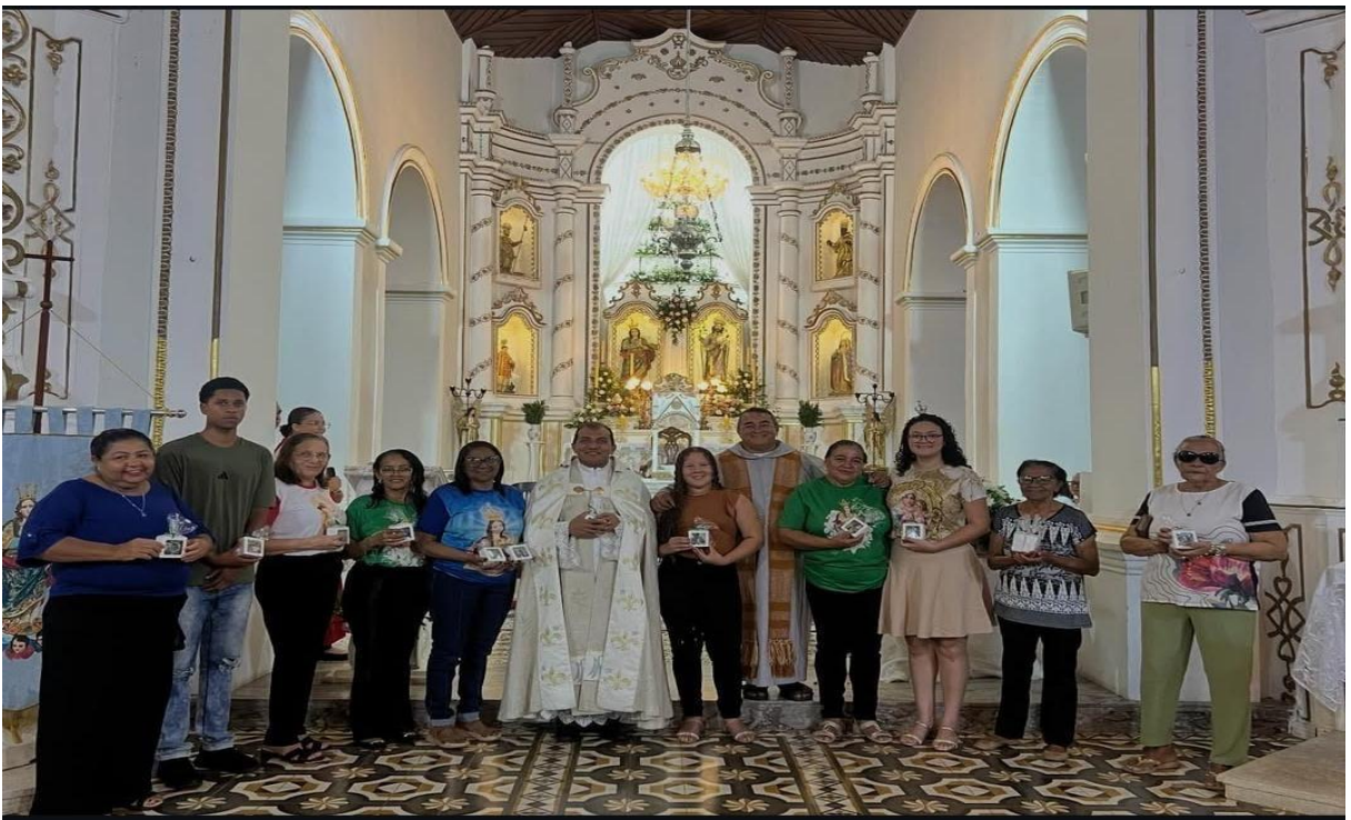
Figura 4 – Padrinhos e madrinhas de Nossa Senhora Do Ó, na Festa da padroeira.