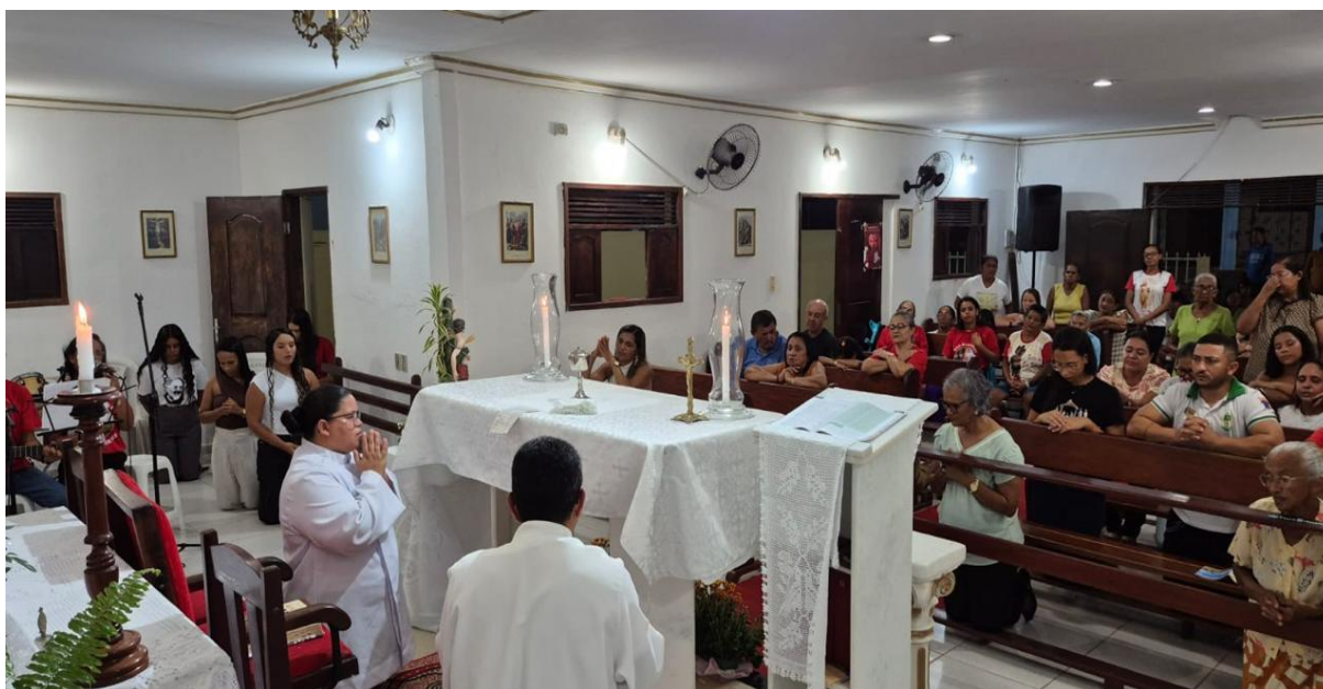
Figura 21 – Primeira noite do Tríduo.