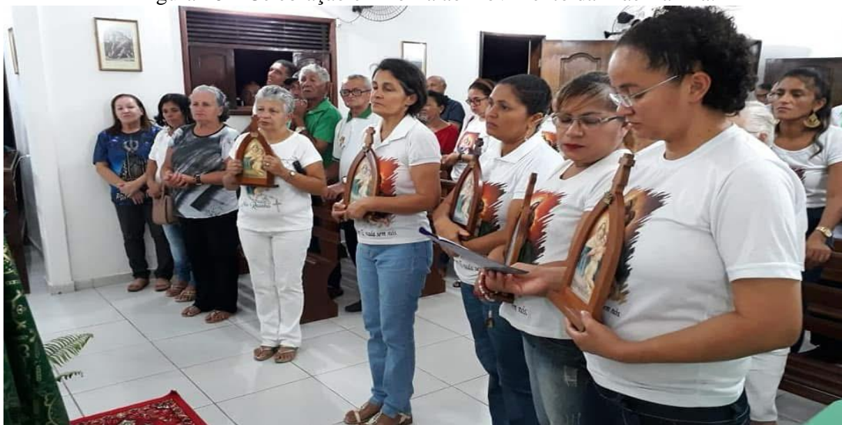
Figura 26 – Celebração em honra ao movimento da Mãe Rainha.