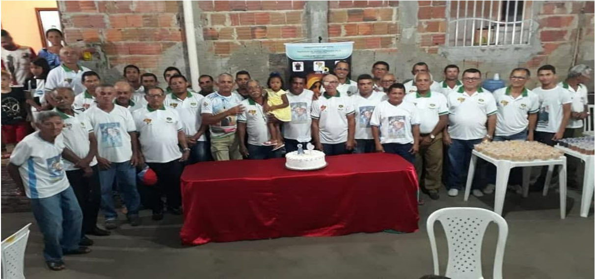
Figura 27 – Movimento do Terço dos Homens em comemoração aos 11 anos de participação.