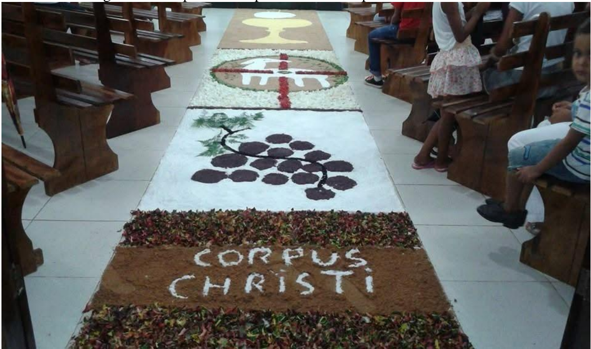
Figura 30 – Tapete de Corpus Christi na Capela de São Sebastião.