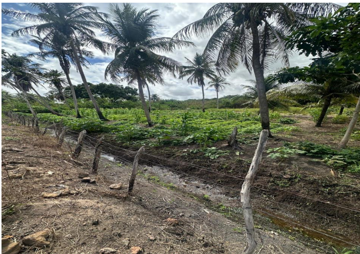
Figura 5 – Roçado de feijão verde, macaxeira, milho, jerimum e batata doce em Currais.

Arraigada por práticas tradicionais vinculadas à cultura rural, a população de Currais tem suas principais fontes de renda associadas à agricultura familiar, destacando-se o cultivo da banana, da macaxeira, da batata doce, do jerimum, do milho e do feijão verde (Figura 5). Paralelamente, a pesca constitui uma atividade recorrente (Figura 6), favorecida pela proximidade com o rio Trairí, sendo a tilápia, a traíra e o camarão de água doce, os principais pescados comercializados pelos moradores.