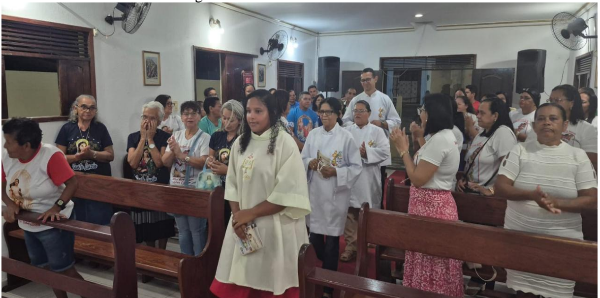
Figura 23 – Terceira noite do Tríduo.