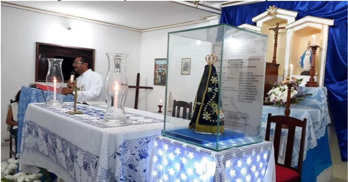
Figura 29 – Celebração em virtude de Nossa Senhora de Aparecida.