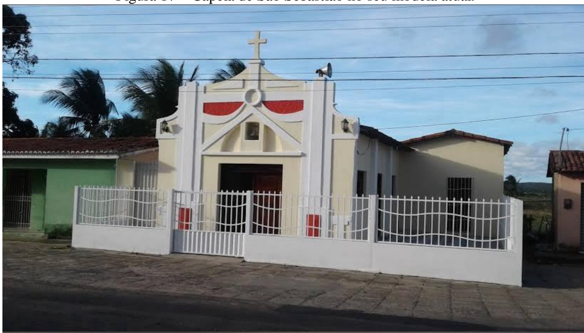
Figura 17 – Capela de São Sebastião no seu modelo atual.