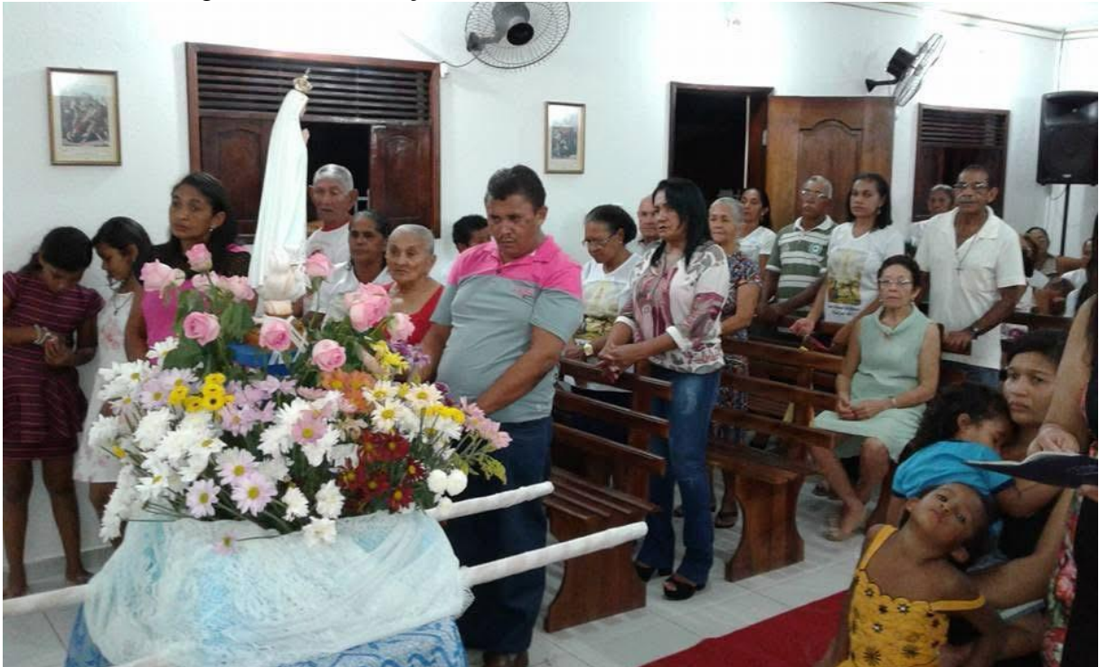
Figura 28 – Celebração em virtude de Nossa Senhora de Fátima.