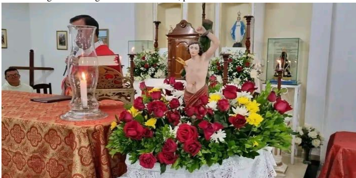
Figura 8 – Imagem de São Sebastião, padroeiro da comunidade de Currais.