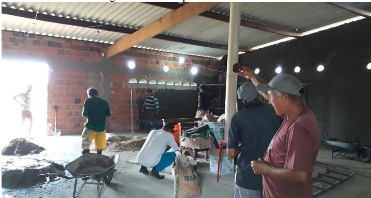
Figura 18 – Construção do Centro Pastoral.