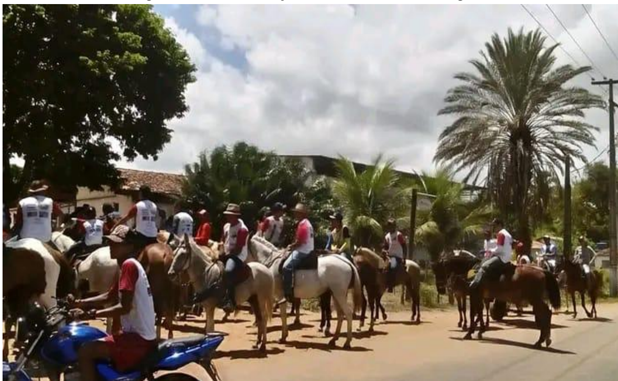
Figura 16 – Concentração dos cavaleiros na cavalgada.