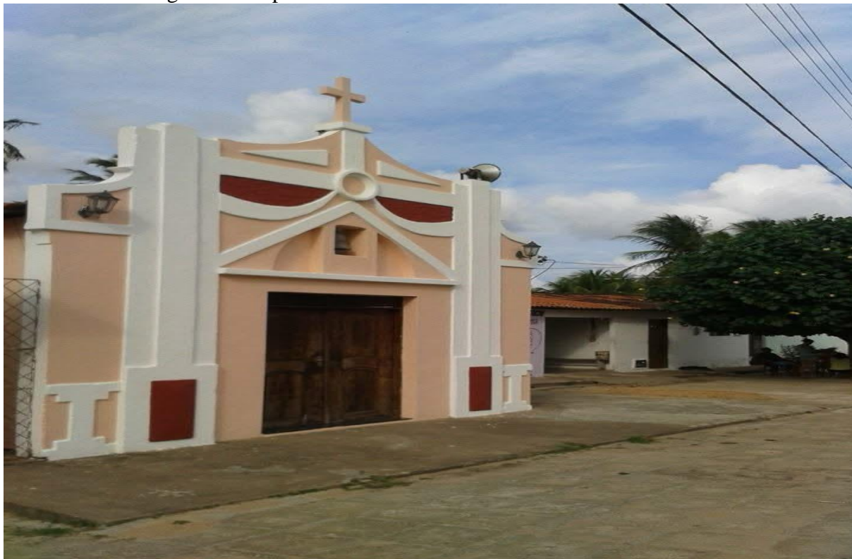
Figura 9 – Capela de São Sebastião na comunidade de Currais.