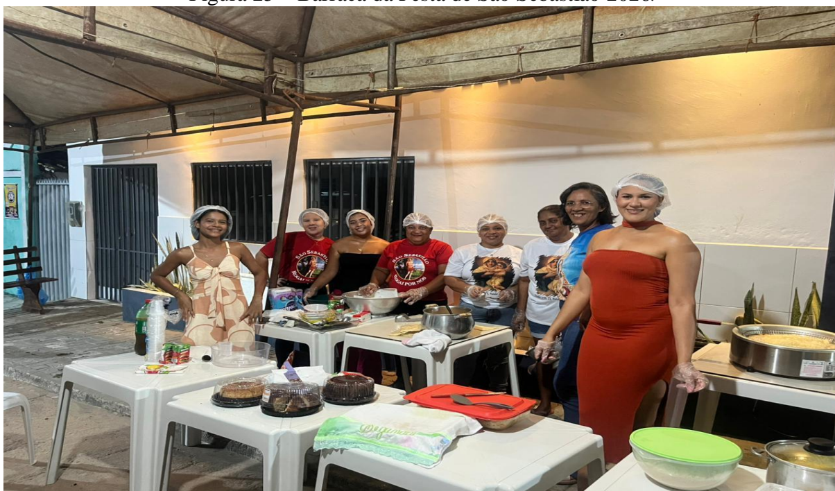
Figura 25 – Barraca da Festa de São Sebastião 2026.