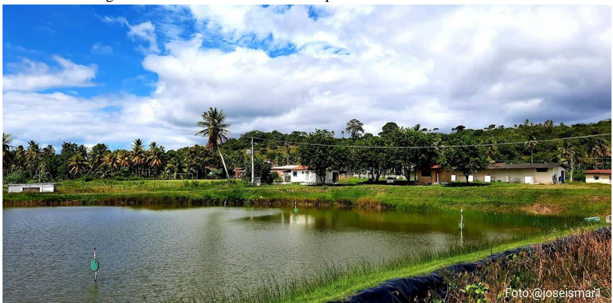
Figura 7 – Viveiro de camarão e tilápia na comunidade de Currais.

Outra fonte de renda que está atrelada diretamente a comunidade são os serviços vinculados à carcinicultura. Alguns moradores mantêm vínculo empregatício formal com fazendas de cultivo de camarão, que produzem também tilápia, enquanto outros são contratados de forma eventual, especialmente nos períodos de seca e despesca dos viveiros. (Figura 7)