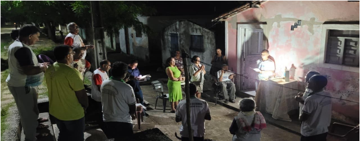
Figura 3 – Terço votivo a Nossa Senhora Do Ó na comunidade Currais, Nísia Floresta – RN.