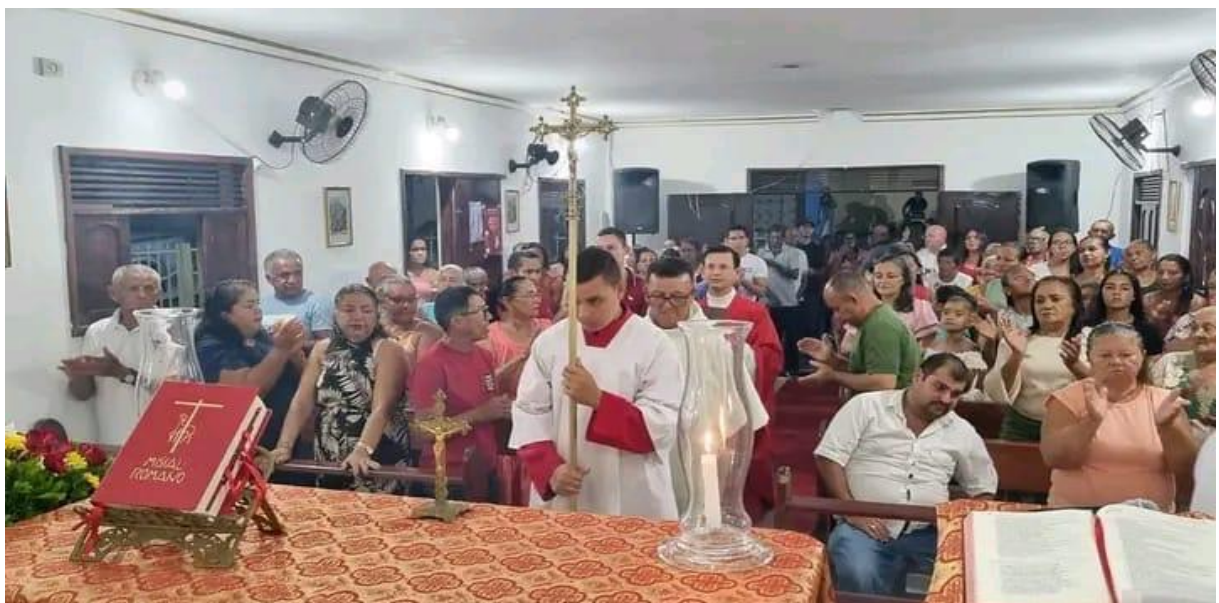
Figura 13 – Missa de encerramento da Festa de São Sebastião no ano de 2024.