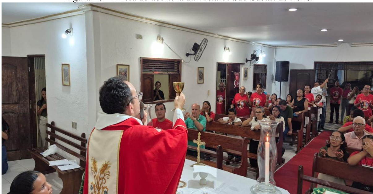
Figura 20 – Missa de abertura da Festa de São Sebastião 2026.