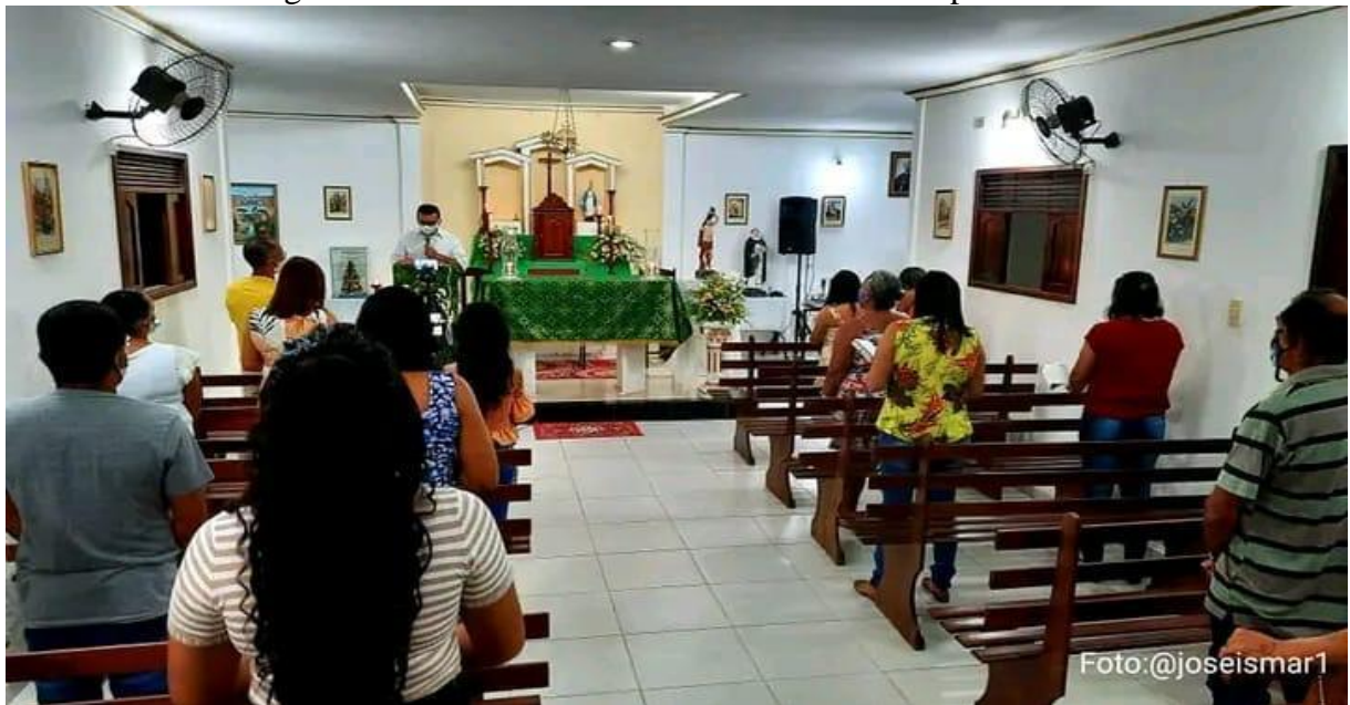
Figura 12 – Tríduo da Festa de São Sebastião na pandemia.