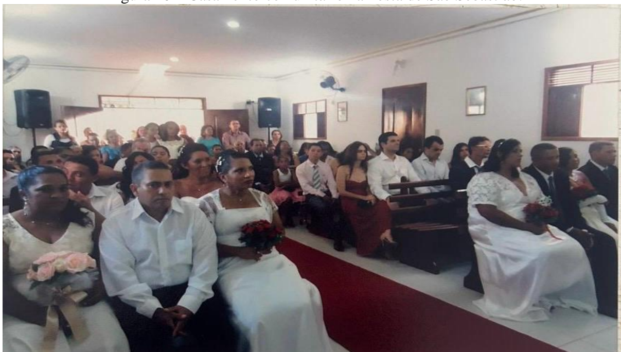
Figura 10 – Casamento comunitário na Festa de São Sebastião.

Como morador da comunidade de Currais desde a infância, fui batizado durante uma dessas festas de São Sebastião, fato que reforça minha devoção ao santo. Assim como o meu, muitos outros batismos e matrimônios encontram-se registrados na história e na memória da Festa de São Sebastião desde a sua origem, evidenciando sua importância simbólica, religiosa e social para a comunidade. Na Figura 10, evidencia-se a fotografia do único casamento comunitário que aconteceu na comunidade, onde sete casais participaram do enlace matrimonial de modo coletivo.