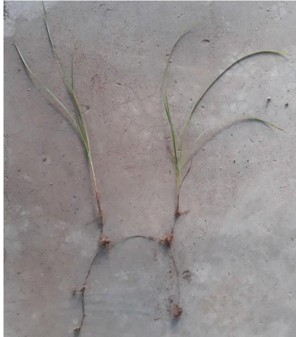
Figura 4 – Coleta dos bulbos.

Os bulbos de tiririca foram coletados no dia 09 de abril (figura 4), e logo após foram padronizados em tamanho e peso (figura 5), para que tivessem maior homogeneidade no experimento, utilizando-se 10 bulbos por vaso, enterrados numa profundidade de 2cm.