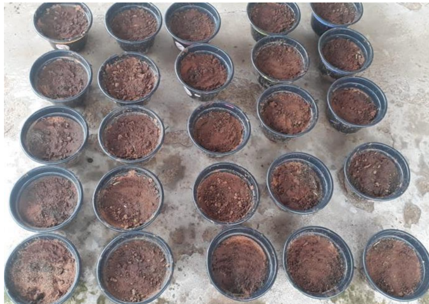
Figura 3 – Montagem do experimento.