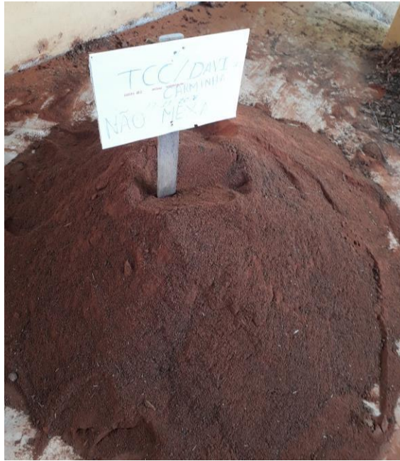
Figura 2 – Preparo do substrato no local Viveiro de Mudanças (IFRN).

O delineamento experimental, foi inteiramente casualizado (DIC), com 5 repetições e 5 tratamentos. O substrato utilizado para preencher os vasos foi constituído pela mistura de barro vermelho e composto orgânico, com proporções de 2:1, sendo cada vaso com capacidade de 3 litros, considerado como uma parcela experimental (figura 2).