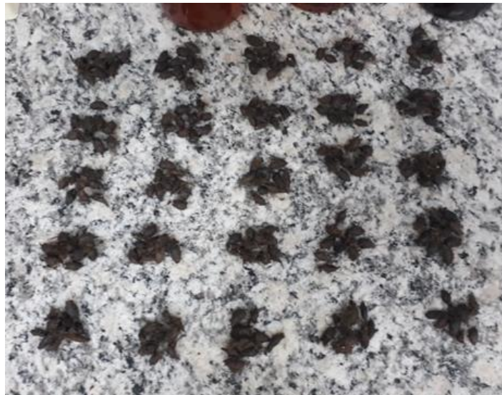
Figura 5 – Separação dos bulbos de tiririca.