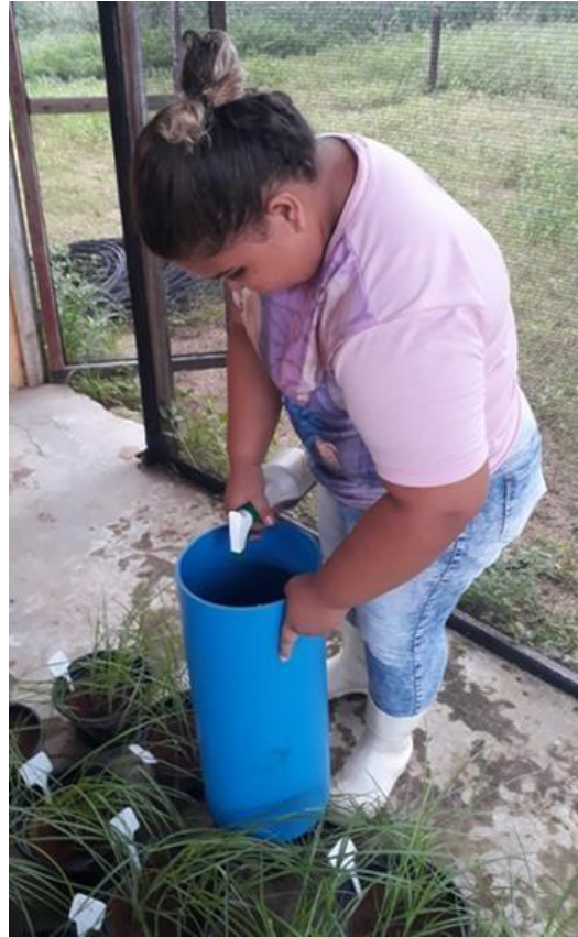
Figura 6 - Aplicação do EA de Mucuna preta.