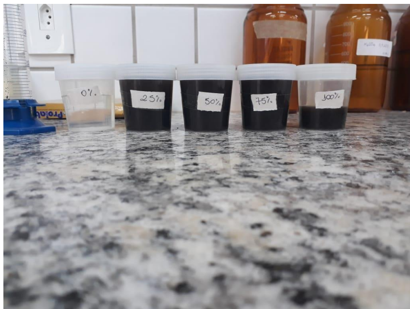
Figura 1 – Extrato Aquoso (EA) de Mucuna pretas em diferentes concentrações

As concentrações utilizadas foram: 0% (EA 0 mL e 1000 mL de água destilada), 25% (EA 250 mL e 750 mL de água destilada), 50% (500 mL EA e 500 mL de água destilada), 75% (EA 750 mL e 250 mL de água destilada), 100% (1000 mL EA e 0 mL de água destilada), (figura 1).