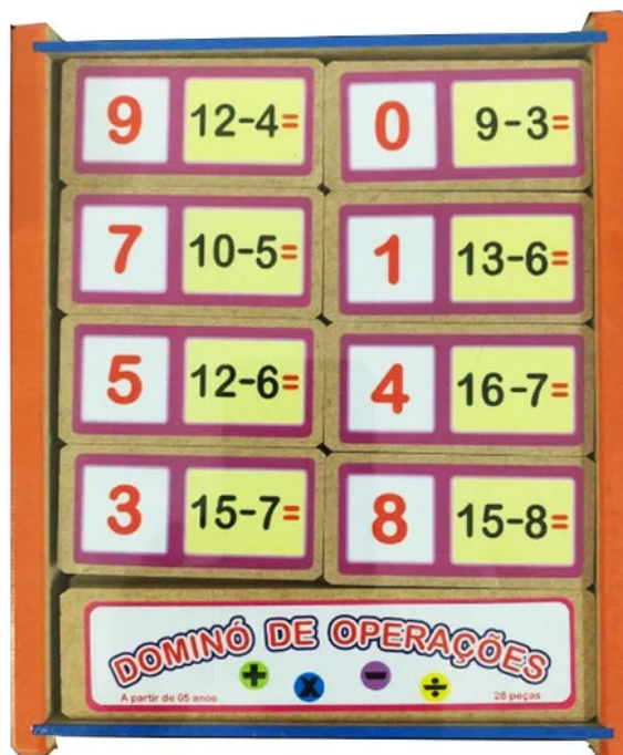
Imagem 3 - Dominó de operação - Subtração Jogo Educativo e pedagógico em MDF.

exercita o raciocínio matemático de cada um, o que também é útil para os alunos com TEA, como podemos averiguar na imagem 3 abaixo: