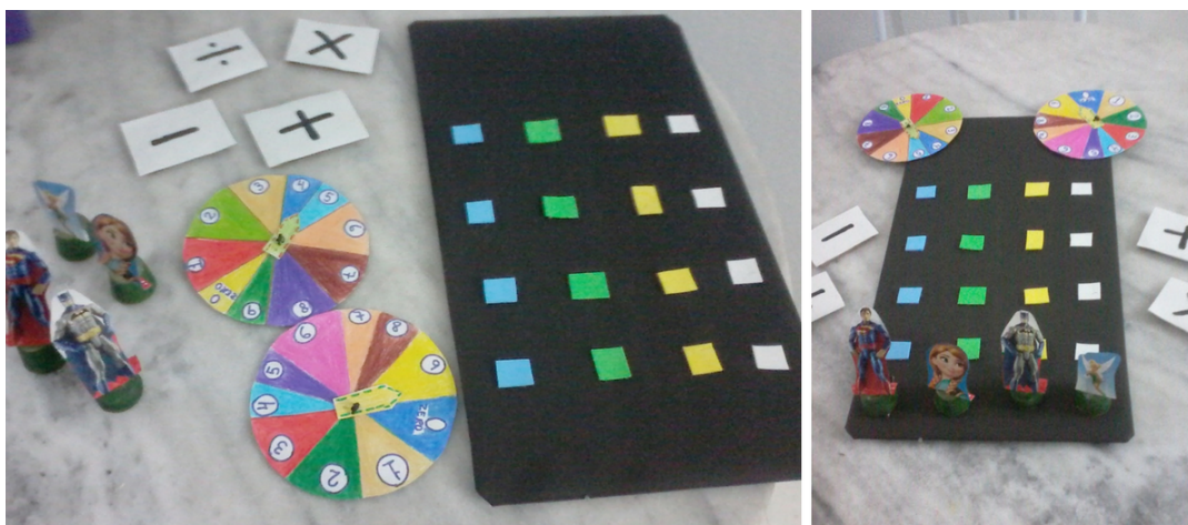
Imagem 6 - Corrida Matemática