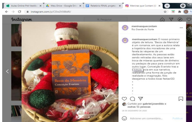
Figura 5 - Postagem de felicitações natalinas usando as obras literárias 16/12/2020.

Fonte: arquivo do projeto de pesquisa (2021)