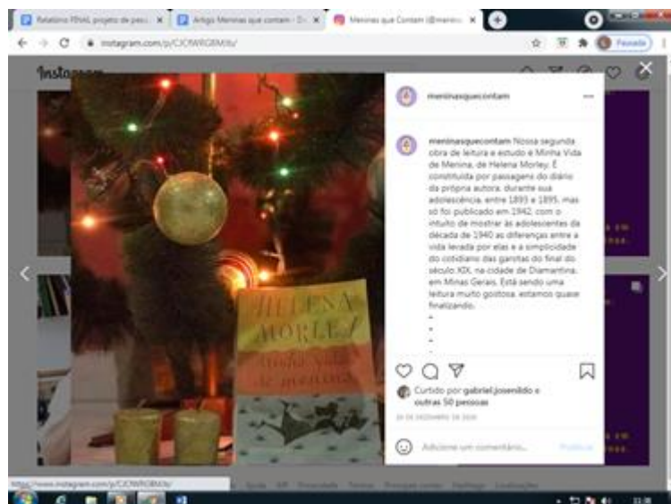
Figura 6 - Métricas do instagram com uma postagem natalina utilizando-se de um dos livros que foram estudados - 20/12/2020.