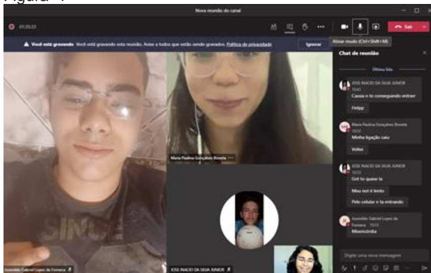
Terceira reunião do projeto -16/10/2020