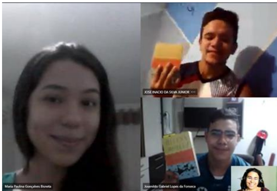
Reunião via Microsoft.teams: dia em que os bolsistas receberam suas obras de estudo - 27/11/2020