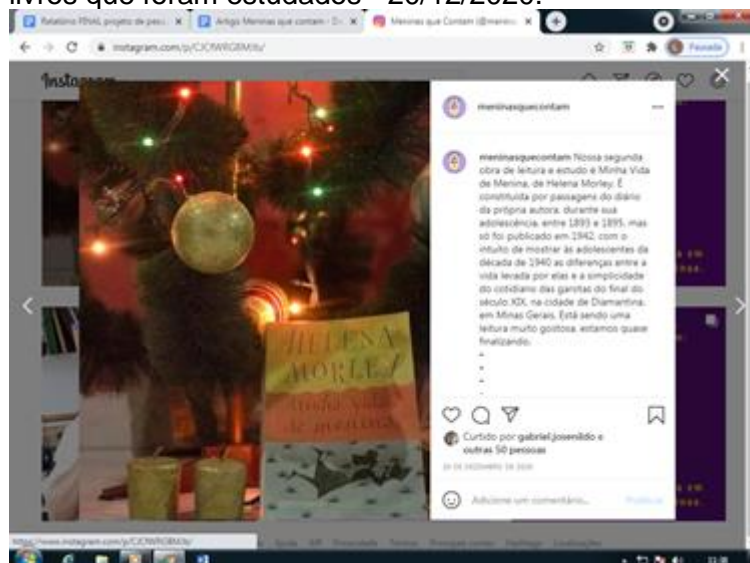
Figura 6 - Métricas do instagram com uma postagem natalina utilizando-se de um dos livros que foram estudados - 20/12/2020.