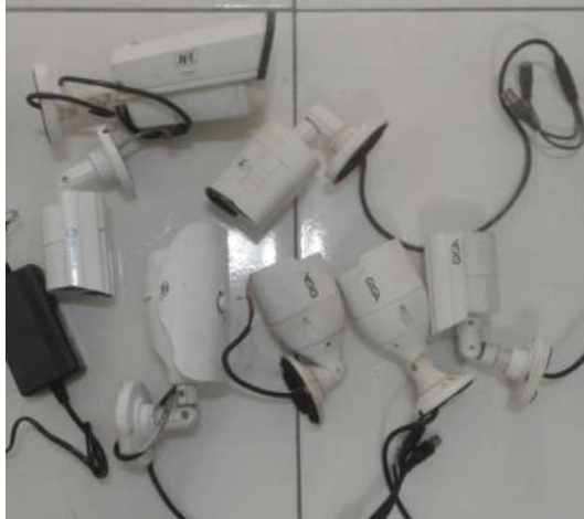
Figura 4 – Exemplos de câmeras de vigilância disponíveis na Marseg.