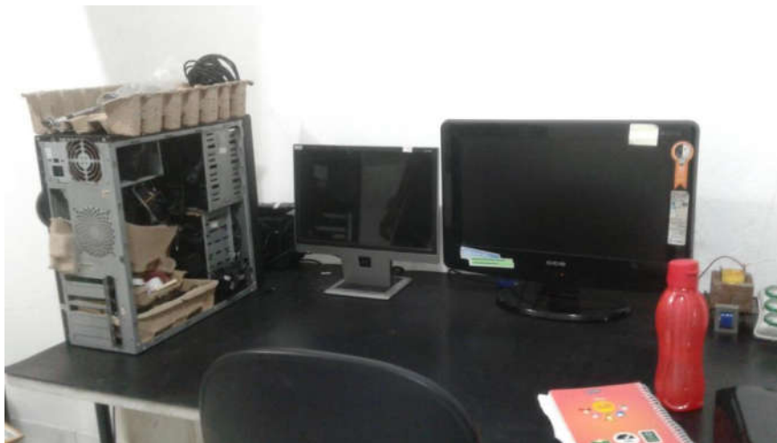
Figura 1 – Bancada utilizada para desenvolvimento das tarefas.