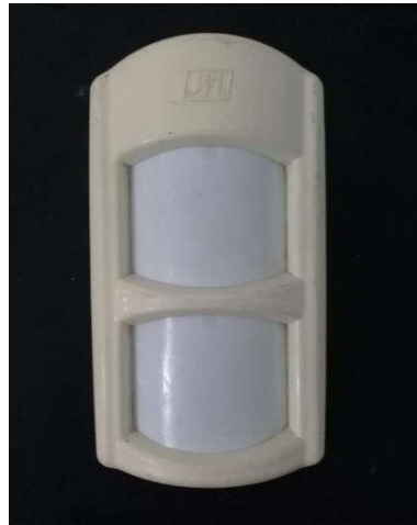
Figura 5 – Sensor Infravermelho JFL IRD-640.

Consequentemente, o sensor era posicionado de maneira que pudesse detectar a presença de uma pessoa a aproximadamente 1 metro de distância. O funcionamento do aparelho era avaliado pelo acionamento do LED presente na PCI: caso ele fosse acionado com a detecção de movimento, o sensor encontrava-se em bom estado; caso contrário, analisava-se a causa do defeito encontrado. Este, normalmente, apresentava-se em algum componente da PCI, e, não havendo possibilidade de troca ou conserto, o aparelho era descartado. Na Figura 5 abaixo vê-se um sensor infravermelho.