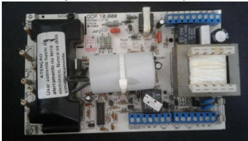
Figura 8 – Central Eletrificadora de Choque.

Dispositivos utilizados na instalação de cercas elétricas, as centrais eletrificadoras de choque (Figura 8) são frequentemente requisitadas pelos clientes da Marseg. Ao retornarem para a empresa, essas centrais normalmente apresentam problemas em seu funcionamento. Estes eram detectados por meio de testes prévios, como a verificação dos componentes, trilhas e ilhas da PCI que compunham as centrais.