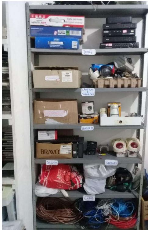
Figura 10 – Estante destinada à catalogação dos equipamentos eletrônicos.

Esse trabalho era realizado com frequência (de três a quatro vezes na semana) na sala de Arquivo Morto, com o objetivo de garantir a organização e o controle do acesso aos itens. Dessa forma, os aparelhos eram separados e dispostos em uma estante localizada na sala supracitada, como exibe a Figura 10 a seguir. Os equipamentos que existiam em maior quantidade, bem como os que possuíam funções mais específicas, eram estocados no armário fixado na sala da direção da empresa.