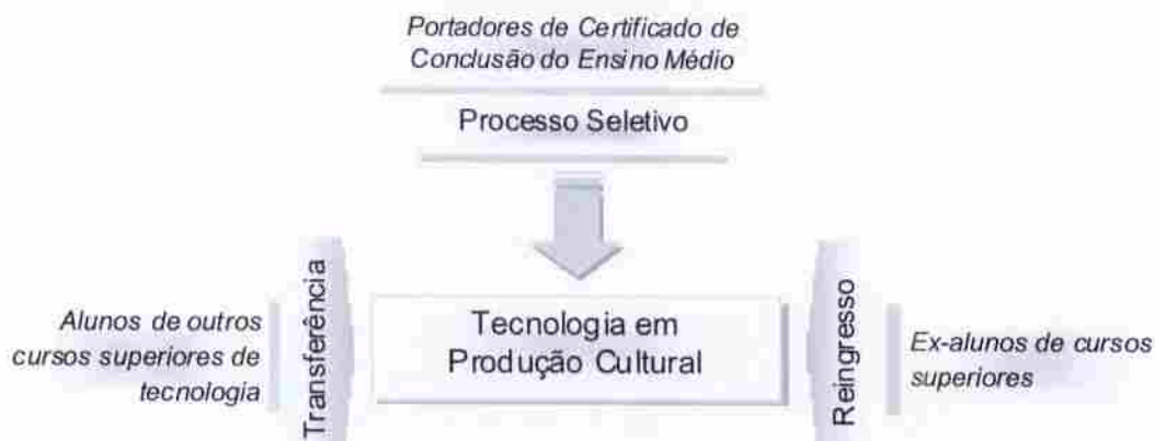
Figura 1 – Requisitos e formas de acesso

Com o objetivo de democratizar o acesso ao Curso, 50% (cinquenta por cento) das vagas oferecidas a cada entrada poderão ser reservadas para alunos que tenham cursado do sexto ao nono ano do Ensino Fundamental e todas as séries do Ensino Médio em escola pública.