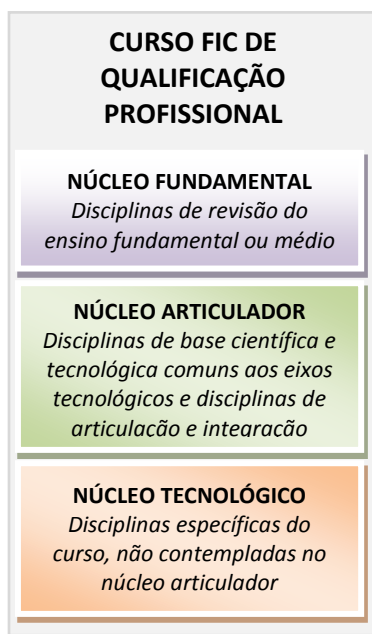
Figura 1 – Representação gráfica da organização curricular dos Cursos FIC de qualificação profissional

Convém esclarecer que o tempo mínimo de duração previsto, legalmente, para os Cursos FIC que atendem ao Programa Mulheres Mil é estabelecido no § 3º do Art. 4º da Portaria nº 1.015/2011.