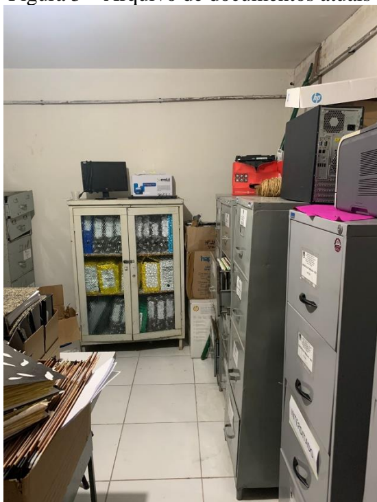
Figura 3 – Arquivo de documentos atuais