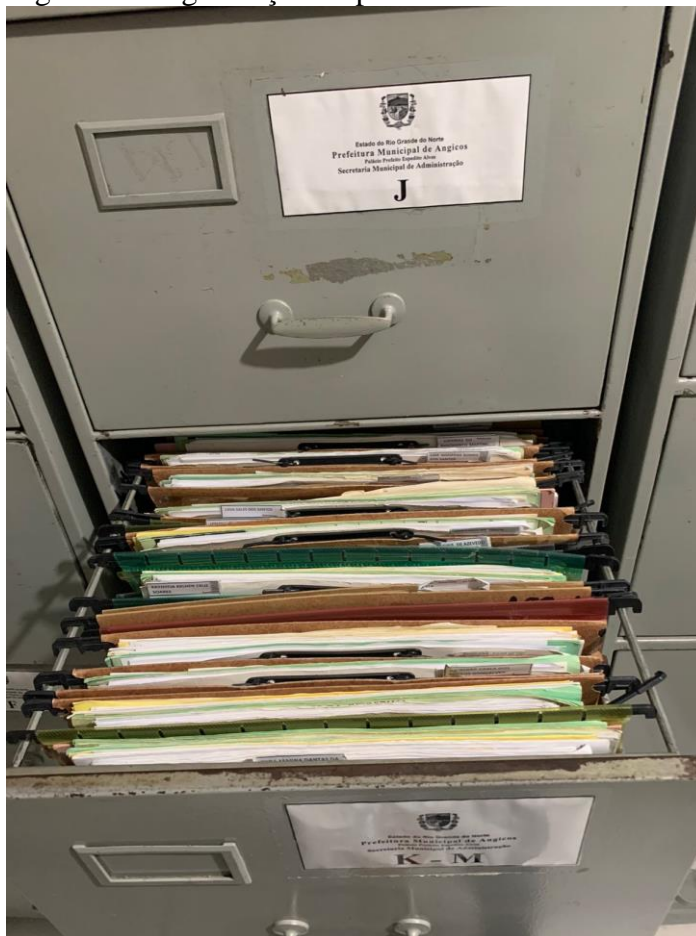
Figura 5 – Organização de pastas em ordem alfabética

Por fim, denominam-se como documentos atuais detidos na secretaria de administração: memorandos e ofícios da gestão atual, pastas de servidores efetivos ativos e inativos e pastas de servidores contratados e/ou comissionados da gestão passada e atual. Já os documentos tidos como antigos são aqueles que sejam de gestões anteriores à gestão passada.