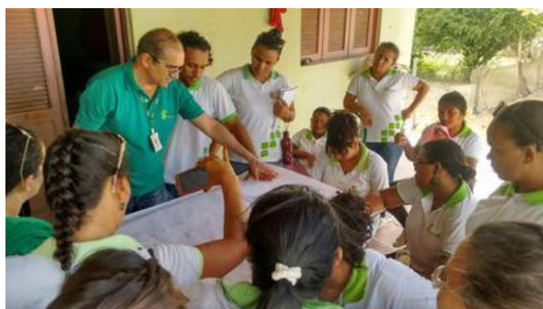
Figura 2. Aula de campo em propriedade certificada.