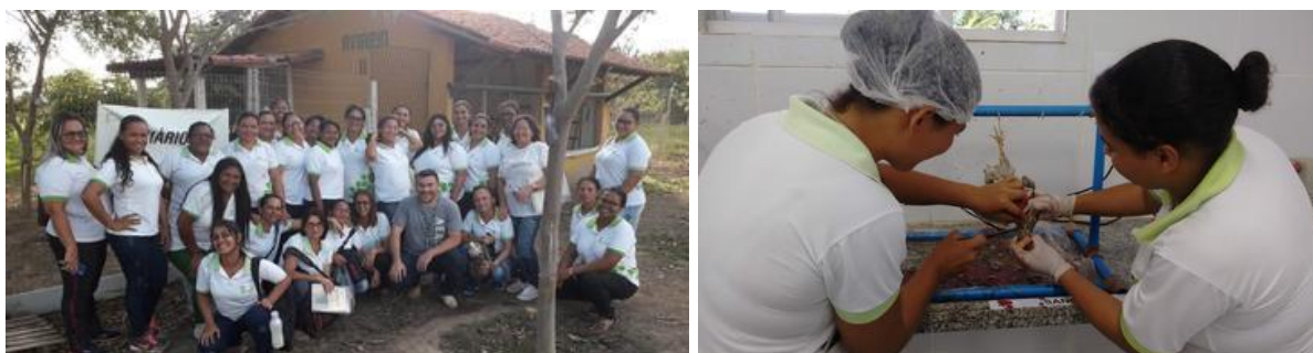
Figura 1. Visita ao aviário (esquerda) e prática de abate humanitário com codornas (direita) no IFRN Campus Ipanguaçu.