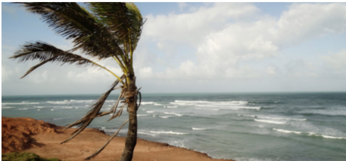
Figura 07: As imagens retratam a praia de Sibaúma e suas atividades de pesca e artesanato.