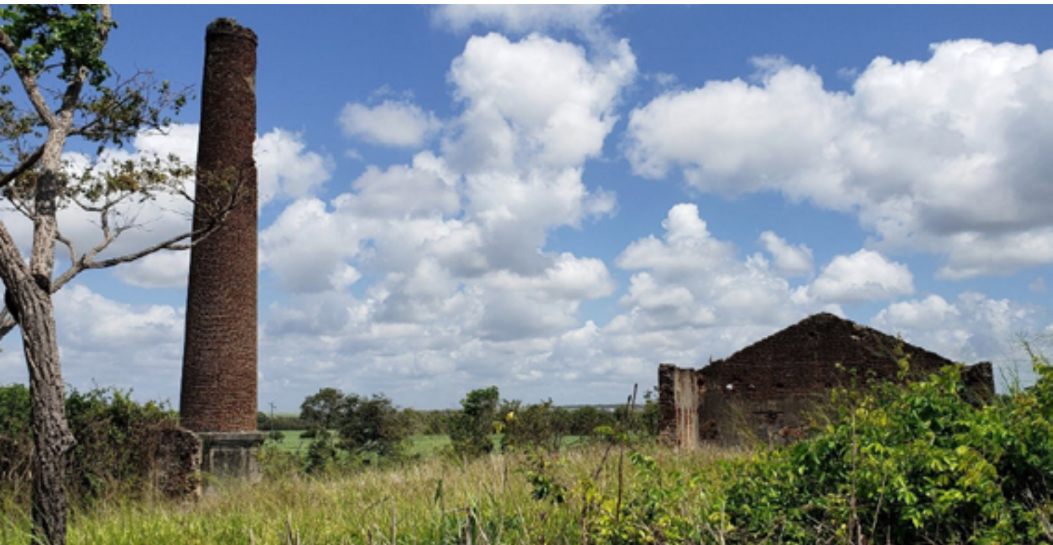
Figura 2: ruínas do “Engenho Ilha do Maranhão”.

Muitas outras perguntas são feitas nessas viagens. As chaminés das usinas e as ruínas dos antigos engenhos também me fazem refletir a respeito de nosso passado não contado. Por isso, não deixei escapar a possibilidade de tomar imagens de drones das ruínas do “Engenho Ilha do Maranhão”, dos canaviais, dos restos da mata e dos rios já sem suas matas ciliares, parcial ou completamente modificadas. São mosaicos de uma história que se expressa na paisagem atual, quase não contada em nossas escolas.