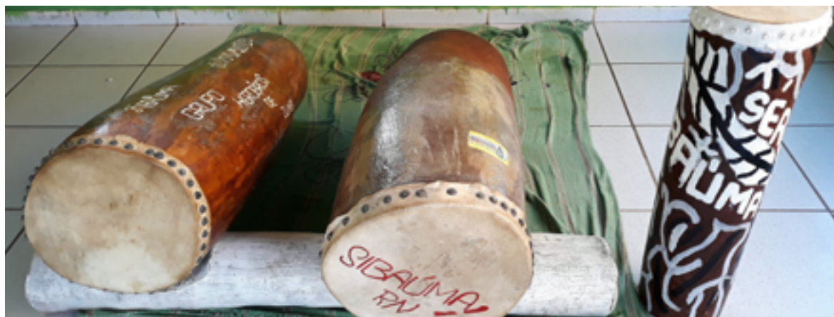
Figura 4: Tambores concluídos, prontos para serem utilizados no coco de zambê.

O arremate do tambor é feito com o acréscimo dos parafusos dispostos às margens de sua beirada (hoje em dia, utiliza-se parafusos, porém, nos tambores mais antigos, eram utilizados pregos). Na sequência, é feita a retirada dos parafusos da base, as aberturas são preenchidas com massa de pó de madeira e cola e realiza-se o corte do couro excedente. Fisicamente, o tambor está pronto, entretanto, a arte de Sérgio expande sua dimensão estética acrescentando pinturas com formas abstratas de sua autoria feitas com tinta a óleo e em poucas cores, predominando o preto, branco e vermelho. Os motivos se diversificam: combinadas às sinuosas linhas abstratas, a assinatura do artista e o nome de Sibaúma unificam-se como elementos pictóricos, alguns instrumentos recebem a data de fabricação ou o adesivo com a logomarca do grupo Herdeiros de Zumbi. A depender do tamanho do tambor, o processo completo pode levar de quinze a trinta dias.