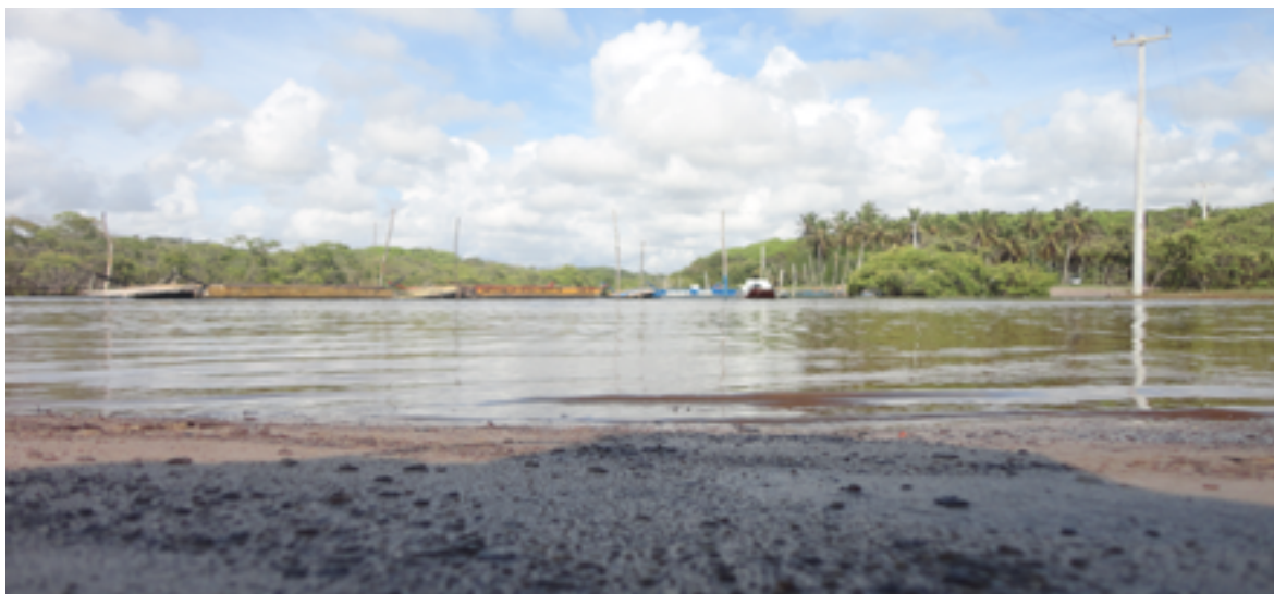
Figura 06: As imagens no canto superior mostram o rio Catu e as balsas para travessia. No canto inferior, retratos da parte da vegetação após a travessia do rio.