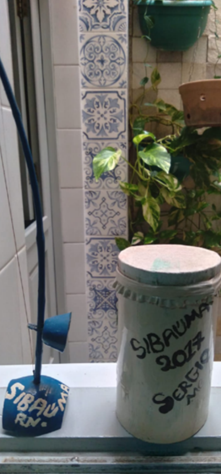
Figura 11: Miniaturas do berimbau e do tambor do coco de zambê.

A pesquisa que originou o presente trabalho, desenvolvido pelo NEABI no campus Canguaretama, tendo por objetivo conhecer a artesanaria simbolizada na criação de instrumentos musicais característicos do coco de zambê, no contexto de uma instituição fundamentada no ensino da Educação Profissional e Tecnológica, gerou diferentes abordagens. Aproxima-se da concepção de formação humana integral, ao assegurar junto à comunidade escolar, por meio da publicação dessa obra, o compromisso em ofertar um ensino pautado numa formação comprometida em integralizar de maneira indissociável ao processo educativo, o trabalho, a ciência, a tecnologia