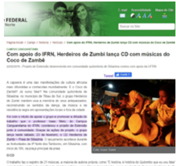
Figura 12: As imagens retratam parte da identidade visual do CD, o dia que entregamos o material pronto e uma notícia no portal do IFRN sobre esse processo.