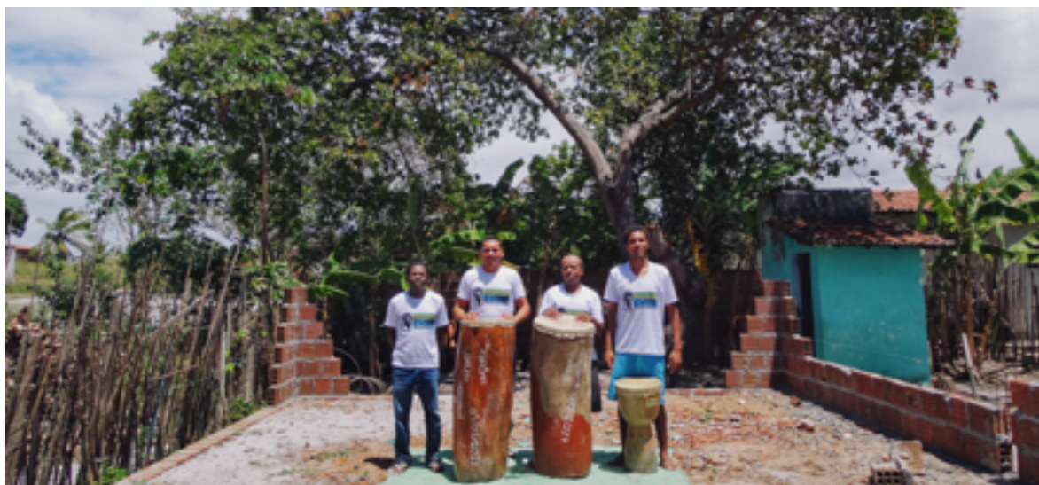
Figura 09: As imagens retratam os instrumentos utilizados pelo grupo Herdeiros de Zumbi.