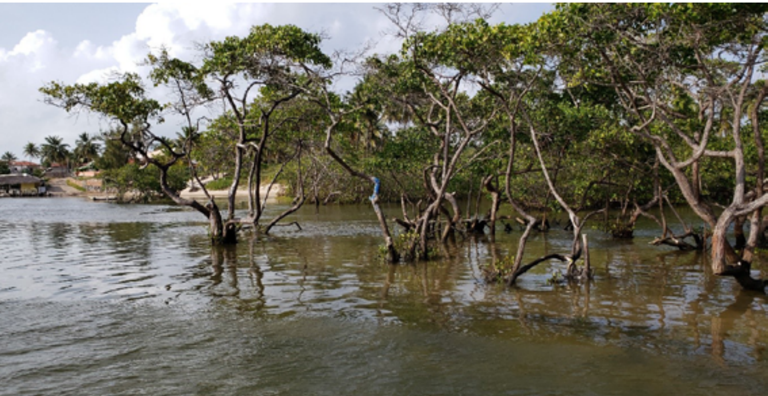
Figura 1: o estuário do rio Catu.

No grupo Herdeiros de Zumbi, nós percebemos uma força e desejo enorme em manter a paisagem preservada e aquelas tradições relacionadas às origens culturais quilombolas, como já fartamente discutido neste livro. Todos com quem conversei entendem a iminência de se perder mais esse pedaço de mata, mais esse lugar de suas lembranças, para o avanço desordenado e agressivo de uma ocupação sem planejamento ou respeito à comunidade tradicional, mas percebemos que não existia em suas falas qualquer sintoma de desânimo ou tristeza, pelo contrário, muita tranquilidade, confiança e força.