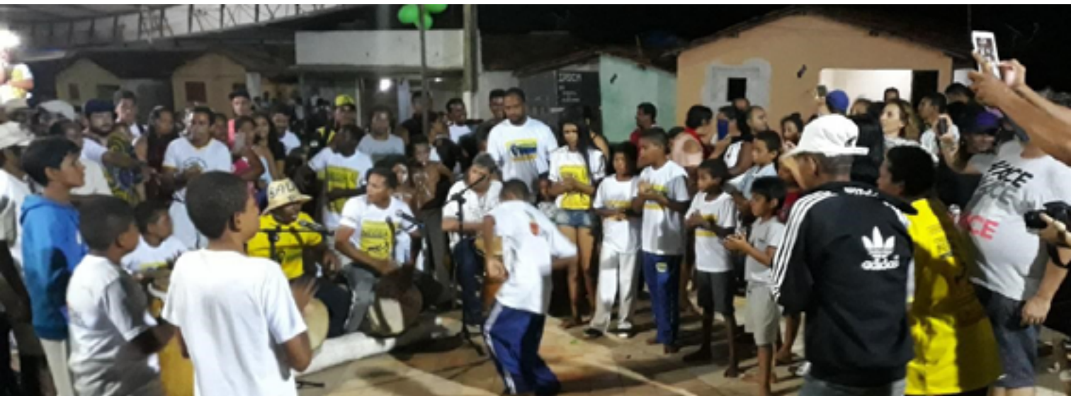
Figuras 5 e 6: Esquente dos tambores e apresentação do grupo Herdeiros de Zumbi na Praça Central de Sibaúma.