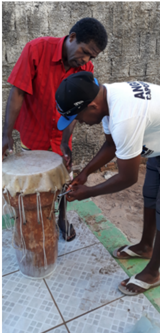
Figuras 2 e 3: Fase do encouramento do tambor.