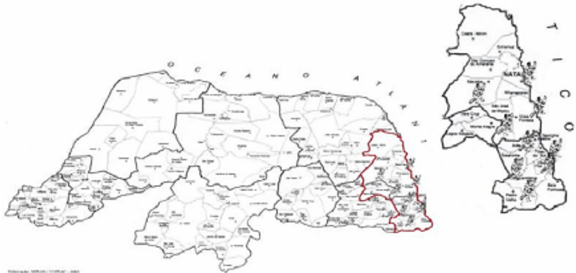
Figura 04: Mapa de ocorrência do coco de zambê no Rio Grande do Norte.

nome ‘zambê’ ao que tudo indica é uma corruptela de Zumbi” (FUTURA, s/ano). O fato é que o coco de zambê significa para essas comunidades um retrato claro de suas identidades, assumindo assim um papel importante, porém com conceitos e interpretações variadas, como fica claro na fala de Mestre Geraldo da comunidade de Cabeceiras também no município de Tibau do Sul/RN: “eles dizem que o Zambê é dança [...] africana [...]. O Zambê é dança nordestina. É! Dança da gente mesmo. Dança nordestina” (FUTURA, s/ano).