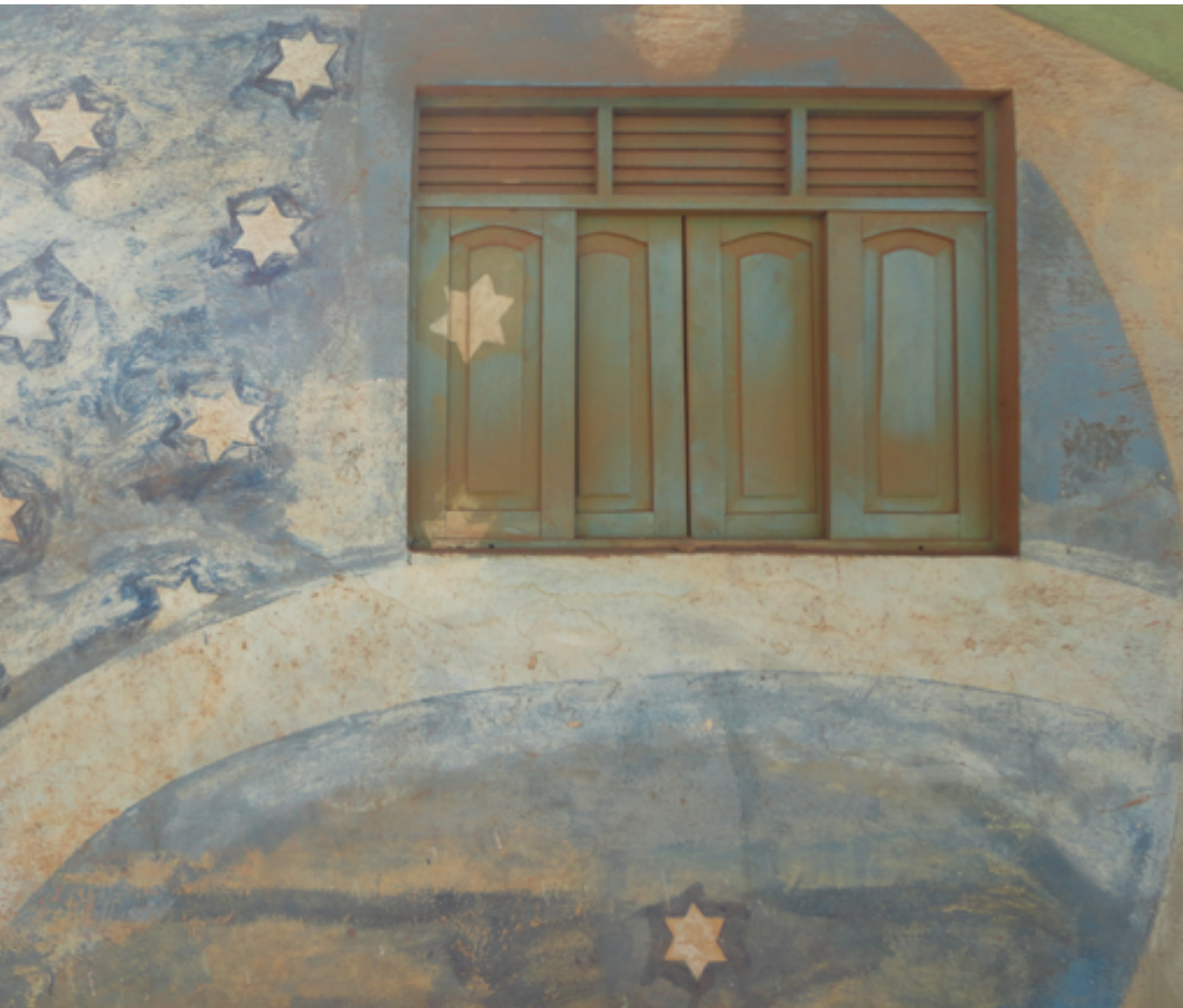
Figura 05: Pintura exposta em casa próximo ao centro da comunidade.