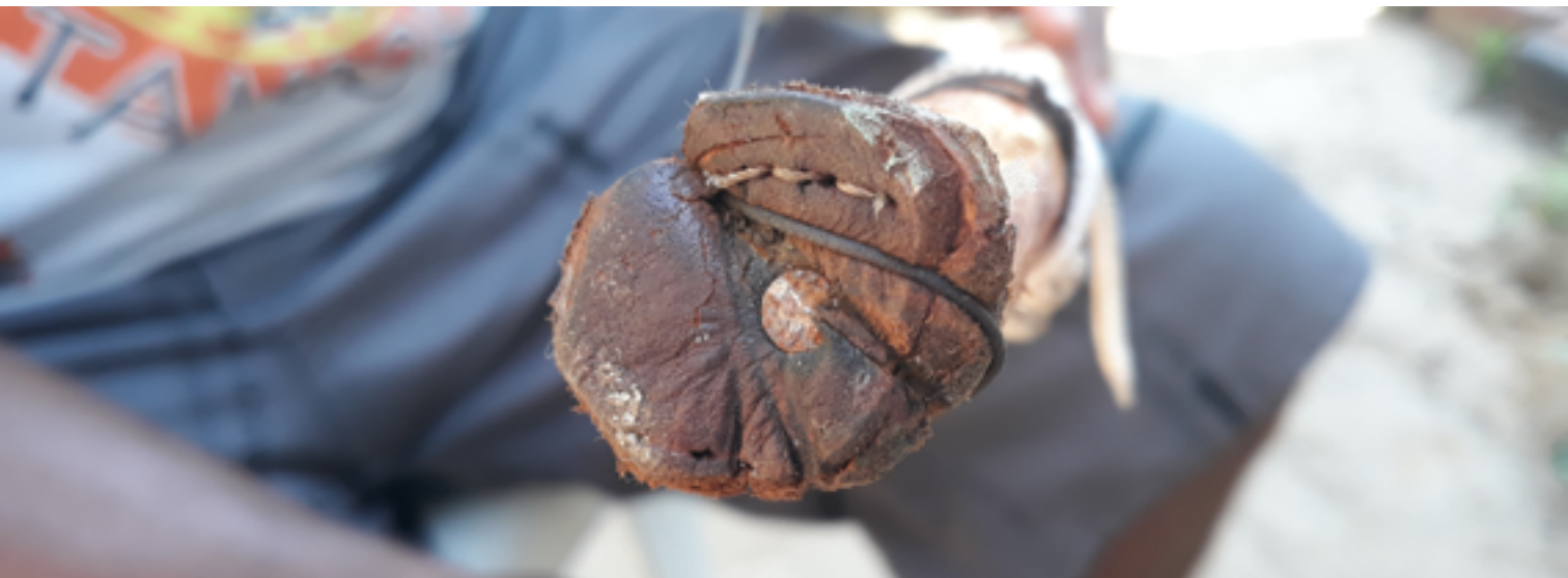
Figuras 7 e 8: “pé e cabeça” do berimbau.