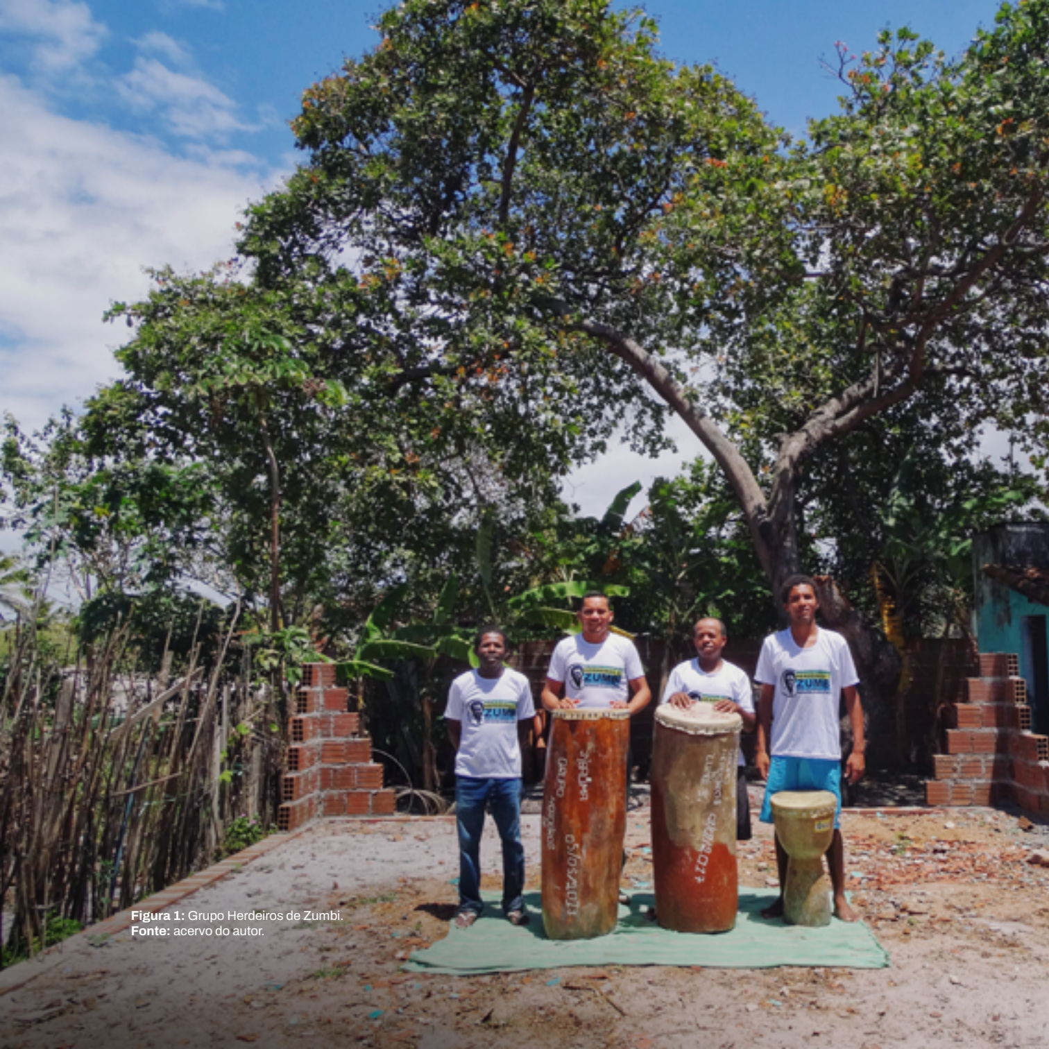
Figura 1: Grupo Herdeiros de Zumbi.