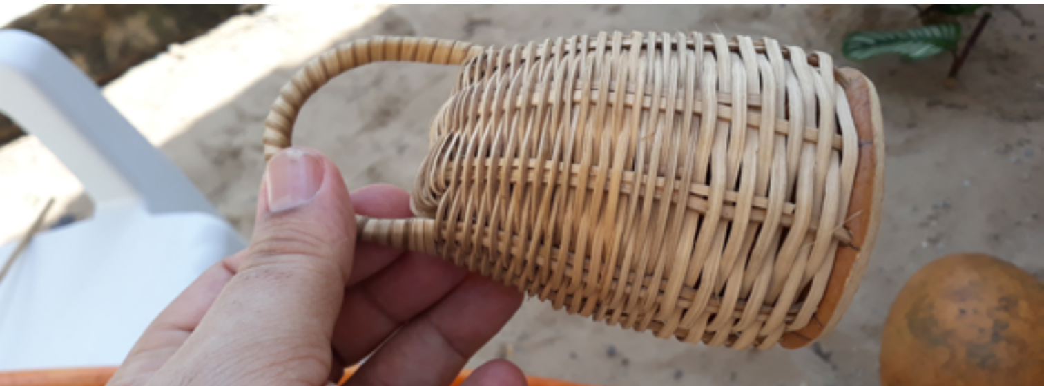
Figuras 9 e 10: Cabaça do berimbau e caxixi.