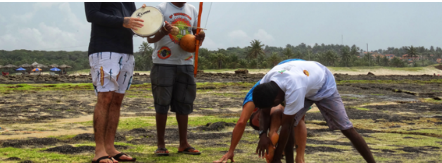
Figura 02: As imagens representam momentos de descontração, amizade e aprendizado com o grupo Herdeiros de Zumbi.