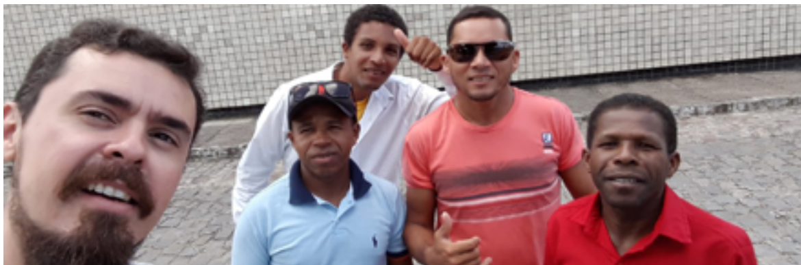
Figura 11: As imagens retratam o dia de gravação dos cocos de zambê do grupo Herdeiros de Zumbi.