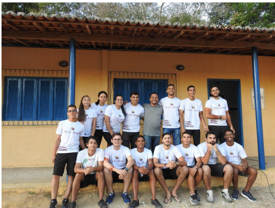
FIGURA 1.5. – 3º Equipe de voluntários da organização da festa da batata.

FONTE: Dados do IFRN-Campus Canguaretama, 2019