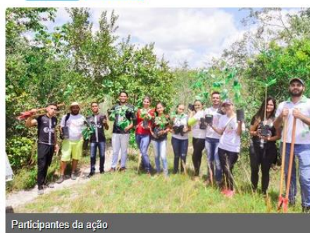
Participantes da ação