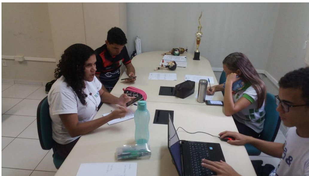
IMAGEM 1.2. - 3º Reunião ordinária do projeto.

Vale ressaltar que em meio aos momentos de planejamento e execução do projeto de extensão, foi preciso construir um calendário de reuniões, para seu desenvolvimento. Com isso, a equipe concordou em realizar reuniões ordinárias pelo menos uma vez na semana, com todos os colaboradores do projeto de extensão. Nestas, foram colocadas as propostas com os pronunciamentos e colocações dos membros presentes. Em consequência disso, criou-se atas para que fossem documentadas as metas a serem cumpridas e os assuntos tratados. A figura 1.3 mostra a foto de umas das reuniões ordinárias.