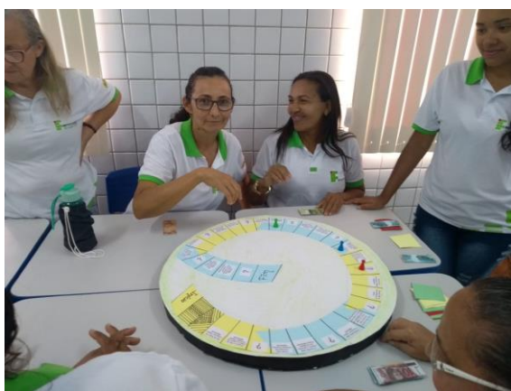
Figura 4 - Teste do jogo com as “Mulheres Mil”

As mulheres integradas ao jogo, na percepção do grupo, em sua maioria, tiveram uma participação bastante dinâmica e participativa, souberam assimilar o que foi passado no jogo, associando-o ao cotidiano das mesmas, no entanto houveram algumas (a minoria) que obtiveram mais dificuldades e não conseguiram compreender o jogo da forma objetivada pelo grupo do projeto em questão. Como ilustrado abaixo: