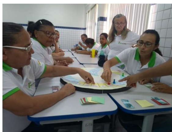
Figura 5 - Teste do jogo com as “Mulheres Mil”