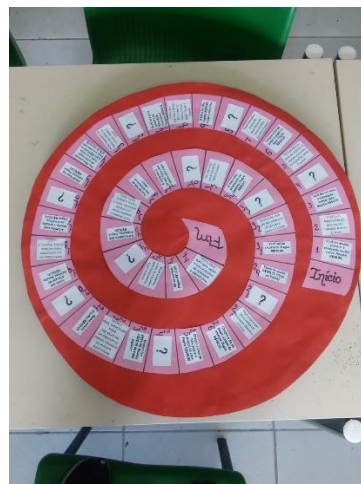
Figura 8 - Tabuleiro do jogo oficial