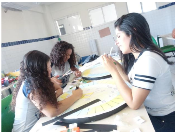
Figura 1 – Construção do protótipo do tabuleiro

O protótipo do tabuleiro do jogo, foi desenvolvido inspirado no jogo “Administrando seu dinheiro”, da empresa Pais e filhos. O passa tempo foi construído a partir da utilização dos seguintes materiais: Isopor, folhas ofício A4, cartolinas, tesouras, fita dupla face, cola de isopor, canetas, dinheiro de papel, dados e pinos de jogo. Seu layout assume um formato em espiral. Como ilustrado abaixo: