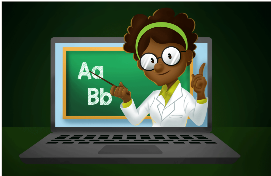
Figura 06 – Programas em EAD.

Fonte: Ilustrado por Eriwelton Paz/Proeja, 2018.