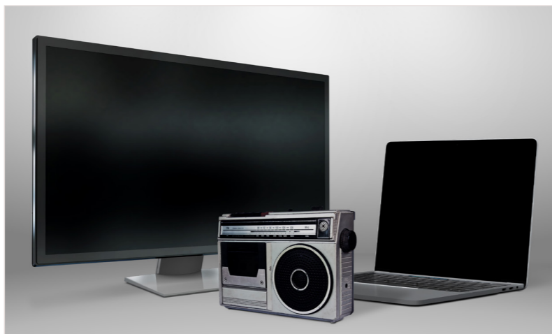
Figura 03 – Rádio, TV e Internet.

A descoberta desses suportes para registro da escrita permitiu a interação através de cartas, telegramas e bilhetes. No século XX, várias invenções vieram facilitar a comunicação: o rádio, a TV, o computador e a internet , por exemplo.