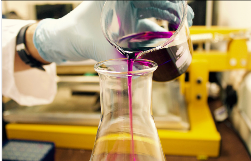
Figura 03 – Ciência.