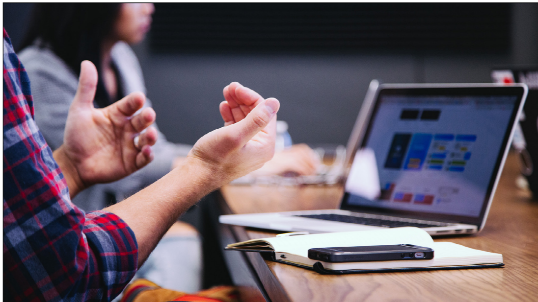
Figura 05 – Webconferência.

Esse recurso fornece ao professor uma alternativa para apresentar ideias, conteúdos e dar suporte às principais dúvidas dos alunos em tempo real.