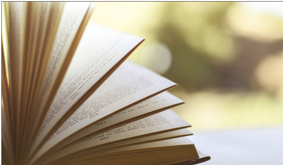
Figura 02 – Material impresso.

Uma das principais vantagens do material impresso na EAD consiste na facilidade de manuseio e de portabilidade.