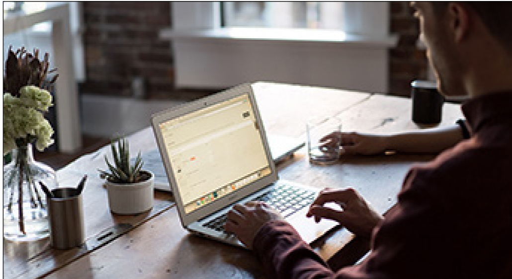
Figura 04 – Homem operando um laptop .