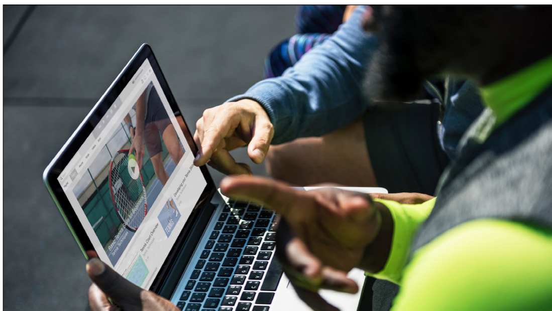
Figura 04 – Videoaula.

Dentro da categoria de vídeos, encontra-se a videoaula, que é uma aula gravada e distribuída aos alunos com o objetivo de ilustrar, reforçar e complementar o conteúdo do curso. É considerada um importante recurso didático que auxilia na fixação de conteúdos, principalmente daqueles de maior complexidade como cálculos, equações, fórmulas etc.