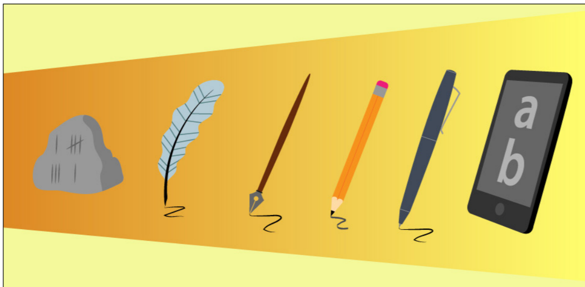
Figura 01 – Tecnologias.

Fonte: Ilustrado por Eriwelton Paz/Proeja, 2018.