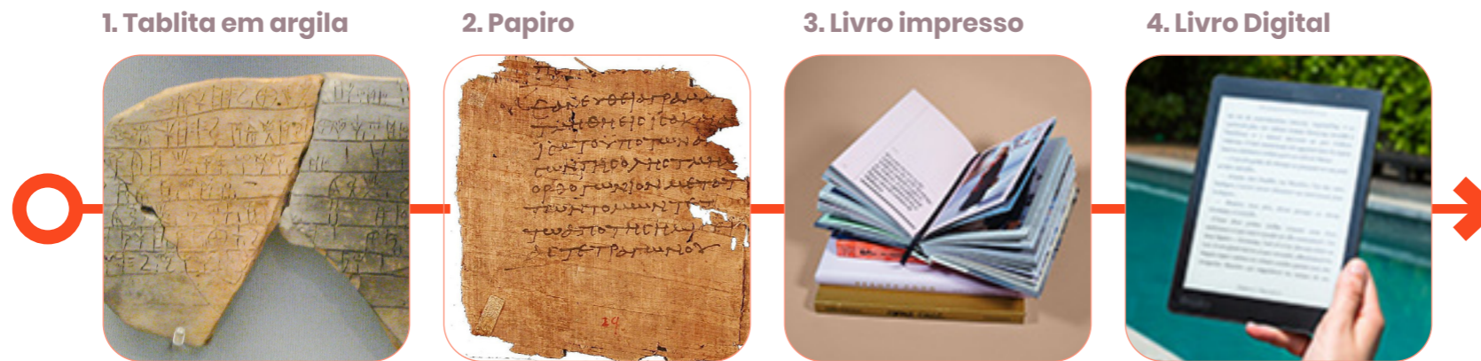
Figura 02 – Evolução dos registros de escrita.