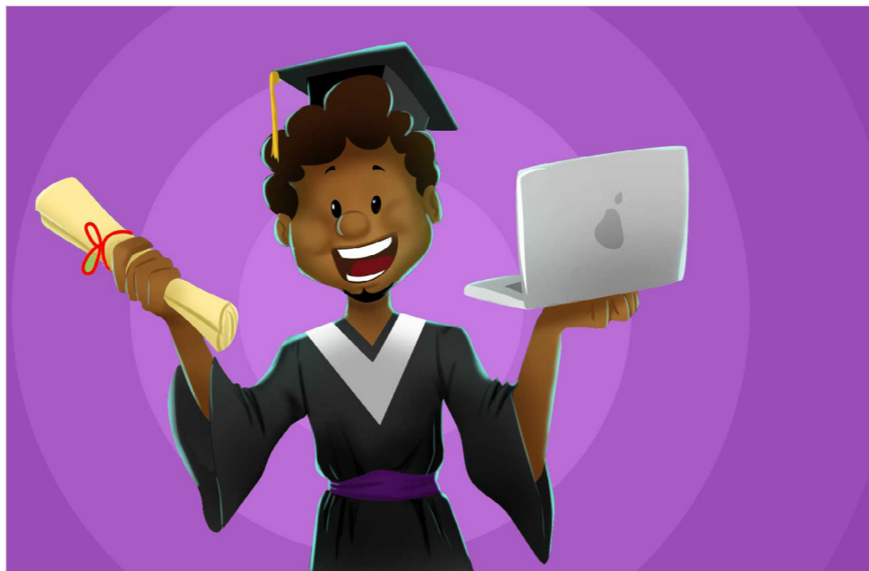
Figura 05 – Educação a distância.

Fonte: Ilustrado por Eriwelton Paz/Proeja, 2018.