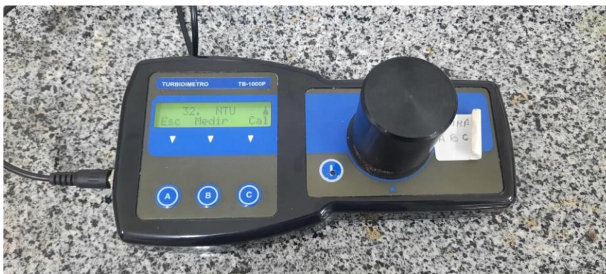
Figura 7 - Medição de turbidez

Primeiramente, foram adicionadas cerca de 60 ml da amostra para um béquer de 150 ml, em seguida, parte da amostra foi transferida para a cubeta para que fosse feita a leitura com o turbidímetro. Após a estabilização, foi feita a leitura.