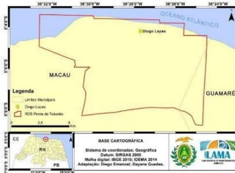
Figura 1 - Mapa da cidade de Macau/RN

Guamaré, Macau possui uma unidade de conservação ambiental chamado de Ponta do Tubarão, criado em 2003 pela lei estadual 8.349 ( IDEMA, 2023).