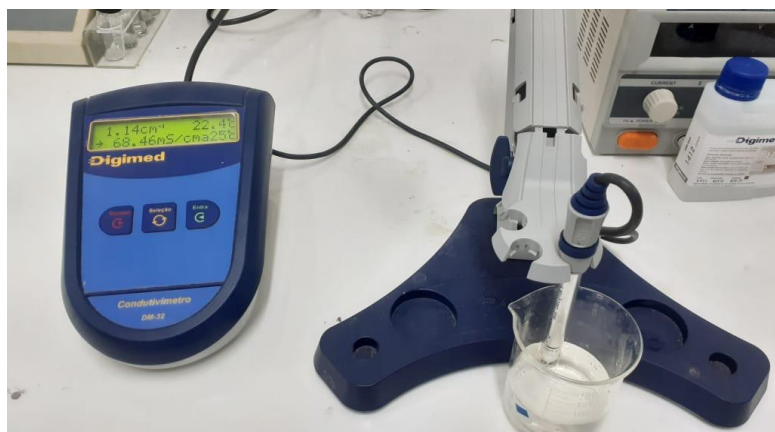
Figura 8 - Medição de condutividade elétrica

A amostra de água coletada foi adicionada em um béquer de 150 ml, após isso, o condutivímetro foi calibrado e introduzido na amostra. Depois de estabilizado, foi realizada a leitura.