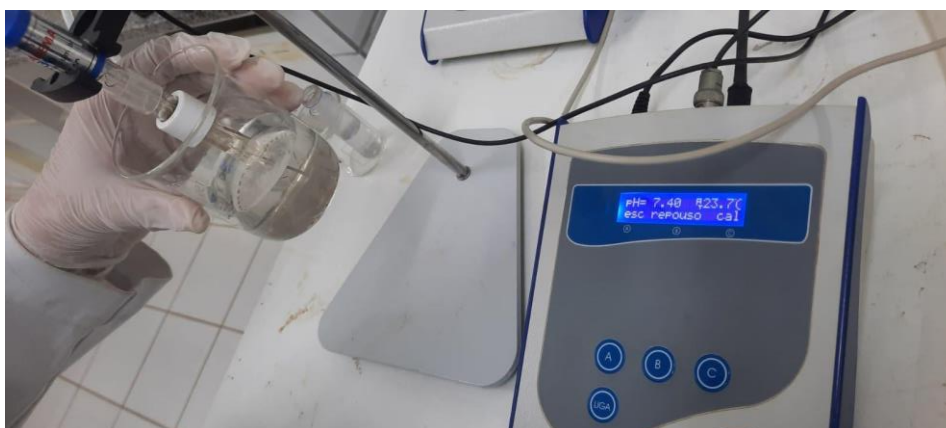
Figura 6 - Medição de pH

Após calibrar o pHmetro, foi coletado uma amostra da água em um béquer, a seguir foi introduzido o eletrodo do pHmetro na amostra. Após a estabilização, foi feita a leitura.